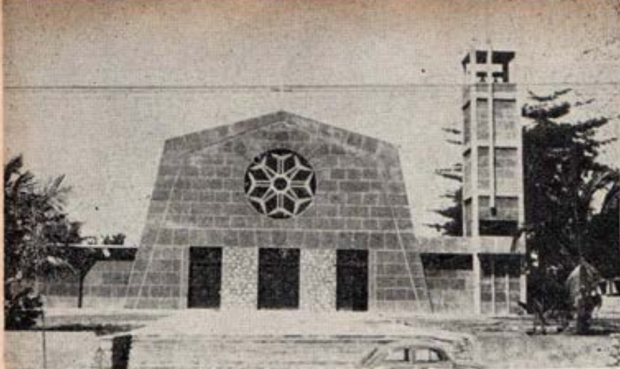
MOZANBIQUE. - Nueva Iglesia dedi- cada a María Auxili- adora en el África Central.