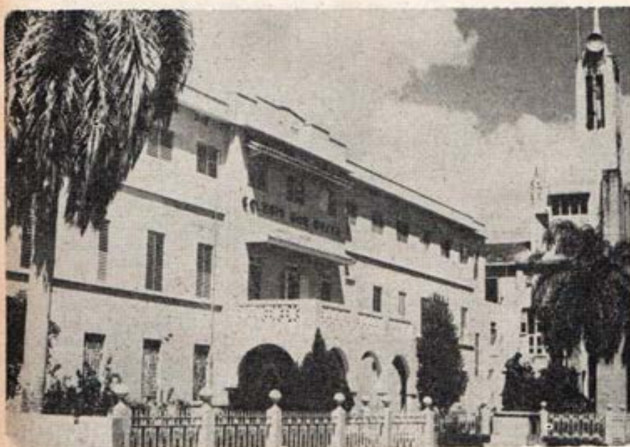
SANTO DOMINGO. - El Colegio Don Bos- co, donde se inició la Obra Salesiana en 1934. El Arbol Sale- siano ha crecido en 30 años.