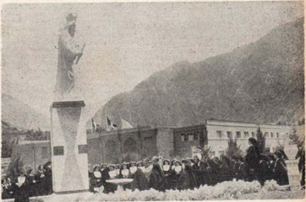
CHOSICA. — En el Noviciado de las Hijas de María Auxiliadora se ha levantado este monumento a la Virgen de Don Bosco. — He aquí un momento de su bendición. Millares de almas que transitan por la Carretera Central saludarán a la Virgen.