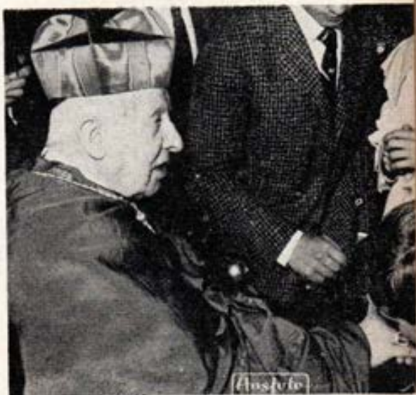
TURIN. - El Cardenal Maurilio Fassati gran amigo y bienhechor de la Obra de Don Bosco.

En 1961 bendijo la primera piedra del grande Santuario a Don Bosco junto a su