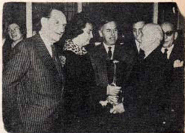
PARIS. - La entrega de la Copa de Oro del BUEN GUSTO FRANCES a la obra salesiana "Amigos de la Infancia".

Mons. Iturriza es una gloria de los Salesianos de Venezuela y la Congregación le tributó un sentido homenaje en la Capital. Tuvo la dicha de bendecir el nuevo Noviciado e imponer la sotana a los novicios en su hermosa capilla.