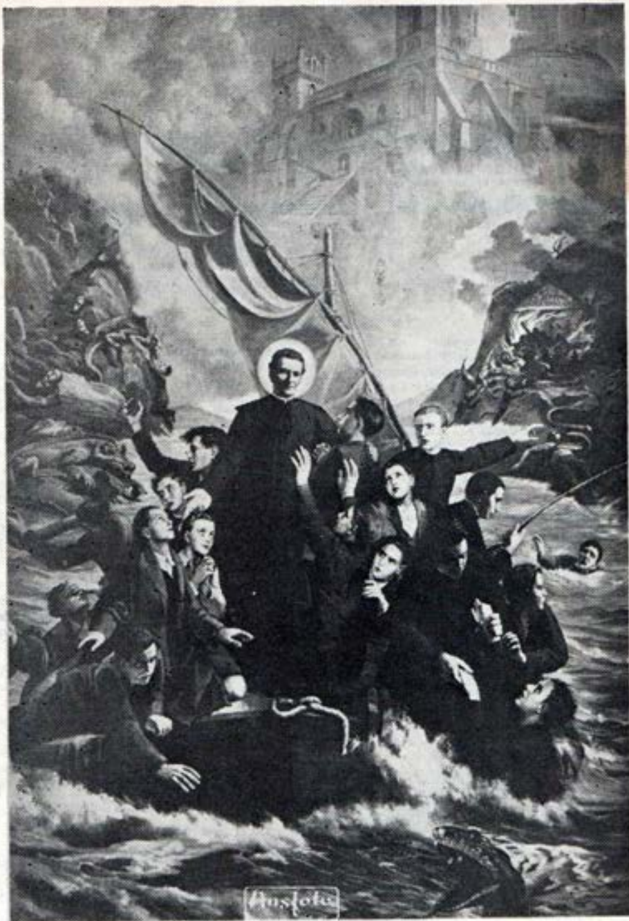
SUENO VISION DE DON BOSCO EN EL AÑO 1866.- Cuadro del pintor Barberis en la Basílica de María Auxiliadora de Turín.

Don Bosco en este sueño vió la misión de la Congregación Salesiana para la salvación de la juventud amenazada por una inundación y muchísimos peligros morales.