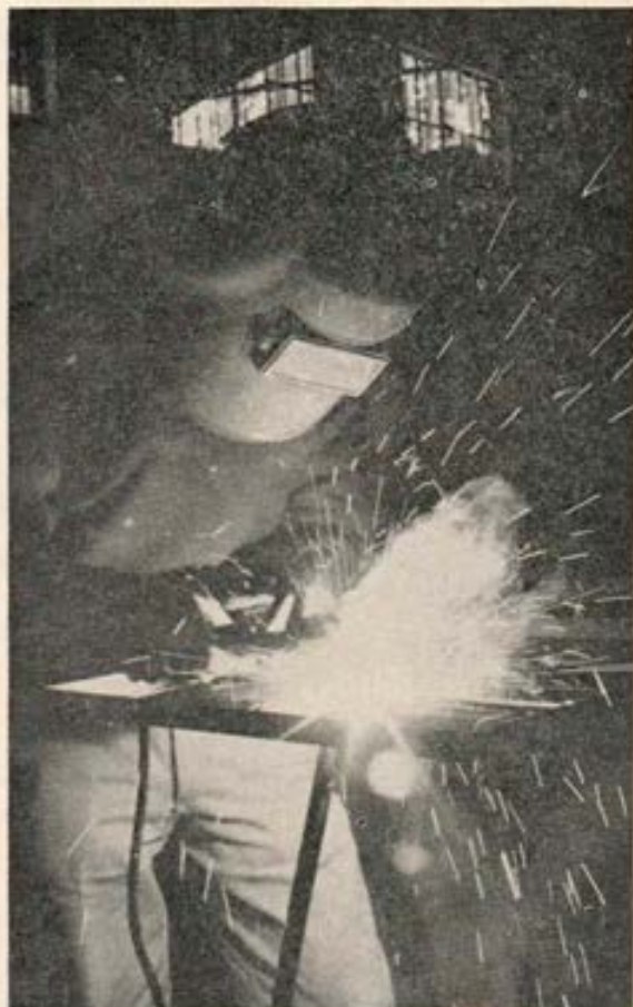
Aprendiz de soldador en el Centro juvenil de Huancayo.

Este centro ya funciona actualmente con rudimentarios talleres de mecánica, electricidad y carpintería, en los que se educan 120 adolescentes de la condición más desheredada de la zona. Igualmente funciona un servicio de co-