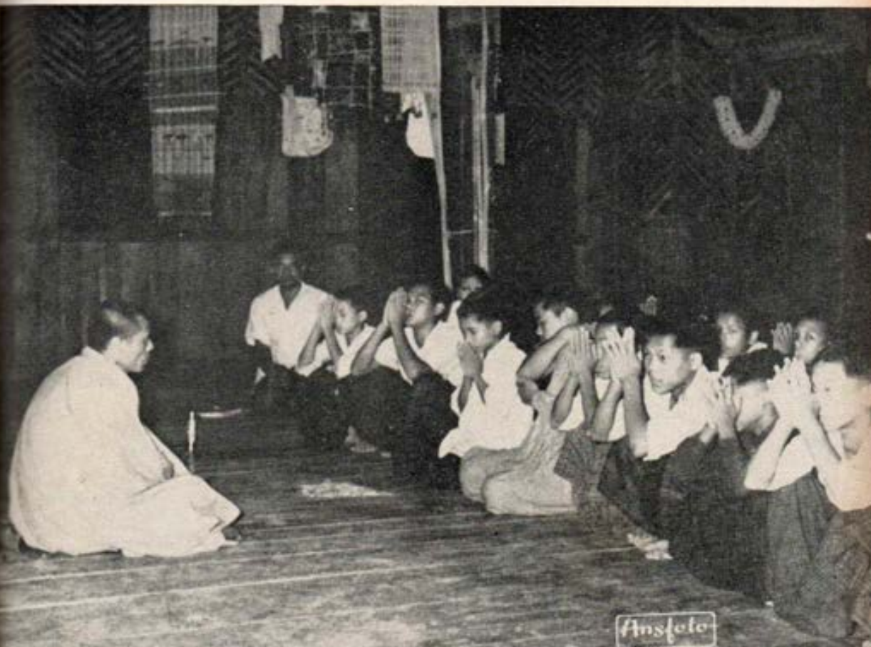
India. Aprendiendo a rezar junto con el catequista.