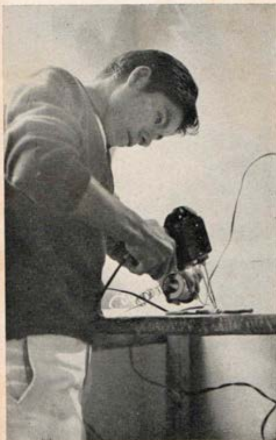
En el taller de mecánica en plena tarea.

su condición económica reclama su inmediata entrega al trabajo, se ha ideado un Plan de Estudios eminentemente práctico y acelerado, despojando los programas de toda clase de cursos puramente enciclopédicos, consagrando en cambio este tiempo al estudio y práctica de las especialidades.