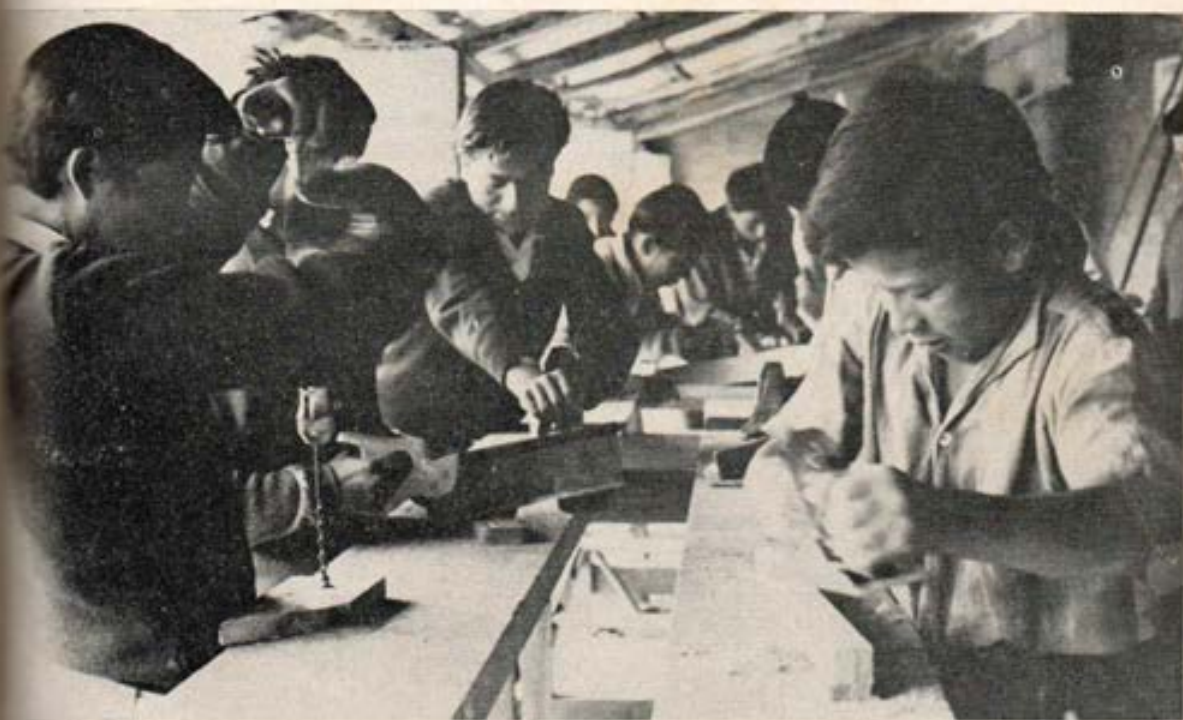
La carpintería forma hombres para el mañana (Huancayo).