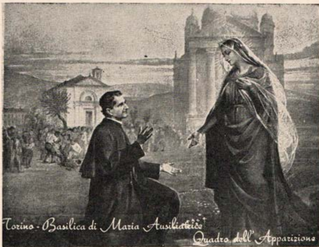
Torino - Basilica di Maria Ausiliatrice Quadro dell' Apparizione