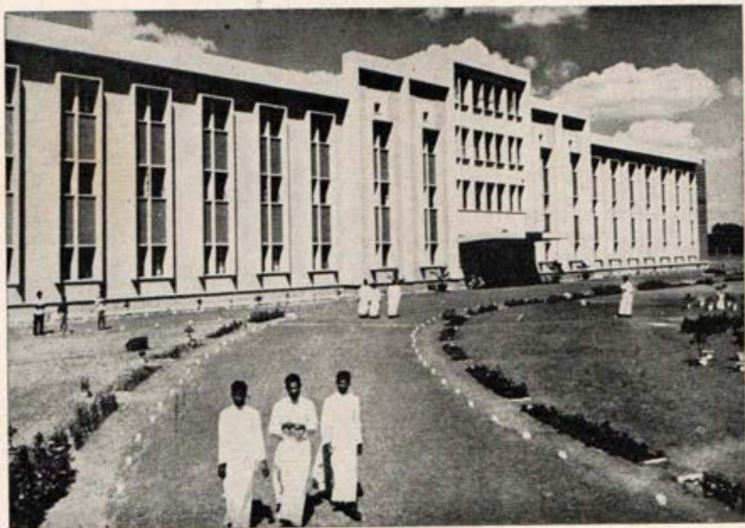
Estudiantado teológico salesiano de la India, construido con la ayuda de los cooperadores.