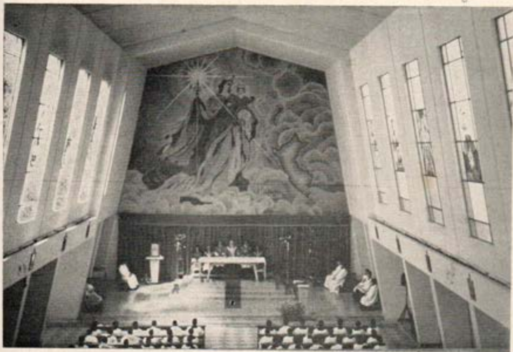
Iglesia de la Casa de formación de Chosica.