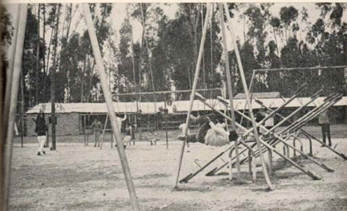
Combinando horas de juego con el aprendizaje (Huancayo).