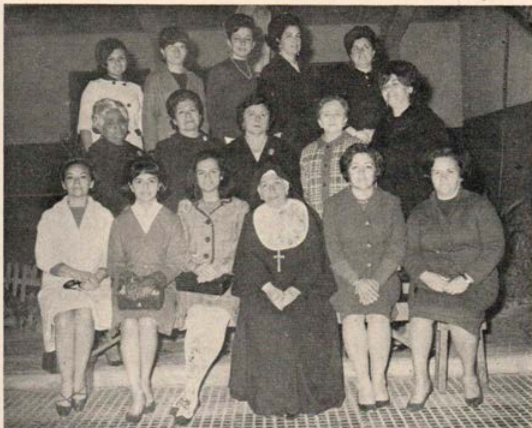
Comisión Directiva de las Exalumnas de María Auxiliadora del Callao.

2) A partir del 12 de Abril todos los Sábados se hará la Catequesis a las Sras. y Niños de la Barriada de Puerto Nuevo. Además de las queridas Exalumnas que