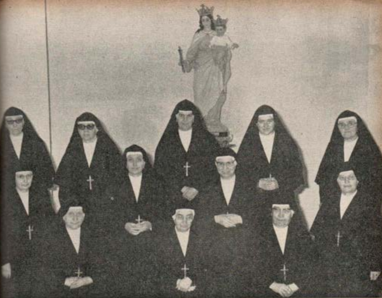
Superiora General y Consejo Generalicio de las Hijas de María Auxiliadora (Roma).