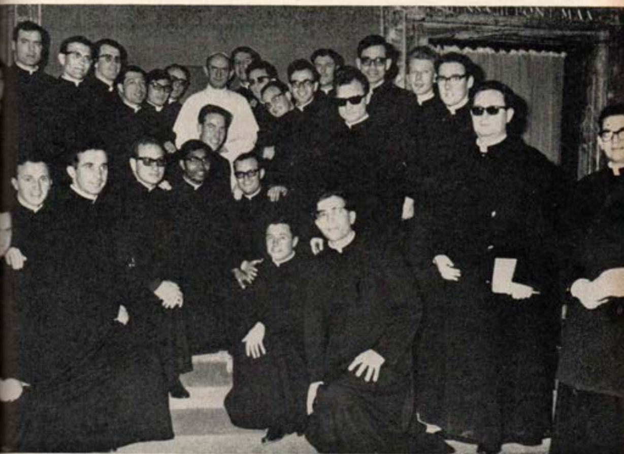
Su Santidad Paulo VI recibe en audiencias a los sacerdotes salesianos recién ordenados.

Mientras me perdía en ese mundo de gritos, de riesgos y de esfuerzos, oigo a alguien que me habla al oído: "vete a la sacristía que D. Bosco va a hacer un milagro", me volteo y no veo más que al clérigo Bonavía, absorto como yo en el partido. Le golpeo en las espaldas para sacarlo de su absorbente atención y le digo: corramos a la sacristía porque D. Bosco va a realizar un milagro. En cuatro saltos estuve en la sacristía, maravillado de que Bonavía no hubiese venido.