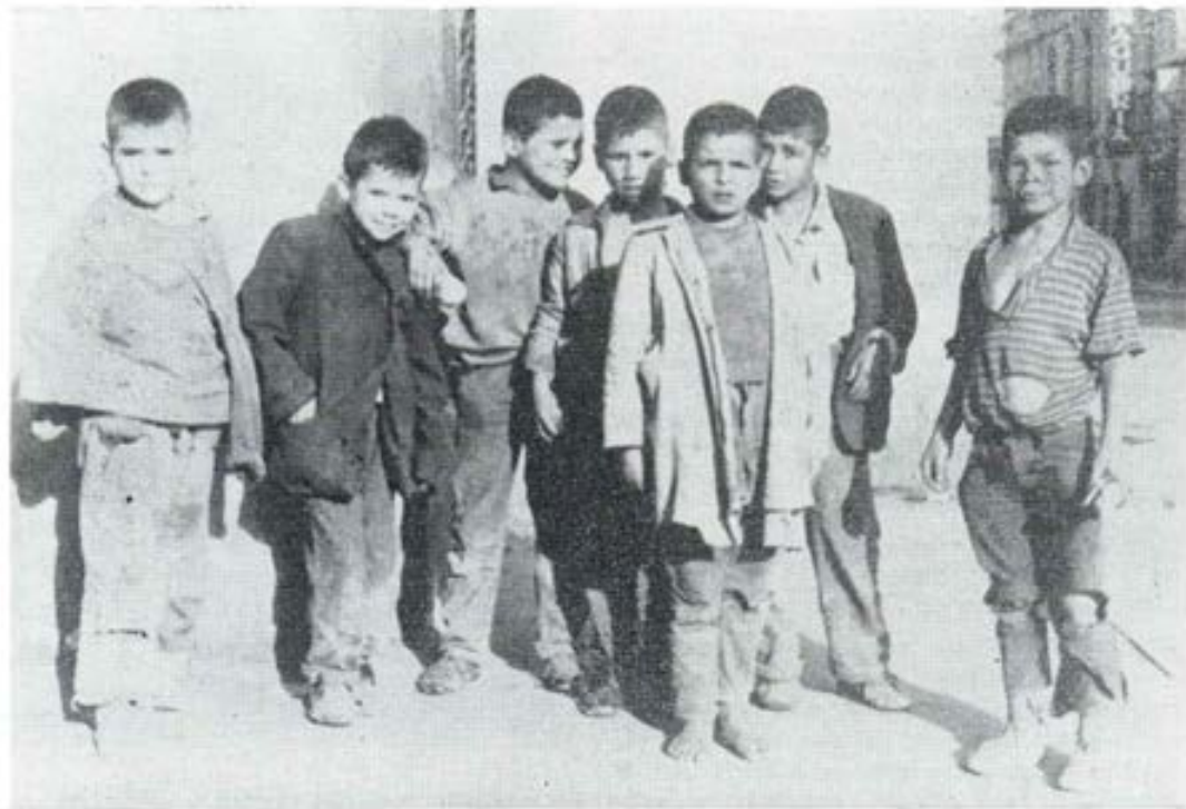
En cualquier parte. La calle: mundo en que se forma la niñez pobre, vestida de harapos

Son palabras que hacen eco a las de Paulo VI: "cuando tantos pueblos tienen hambre, cuando tantas familias viven en la miseria, cuando faltan tantas escuelas, tantos hospitales, todo derroche de dinero público o privado, toda carrera armamentista, se convierte en escándalo intolerable".