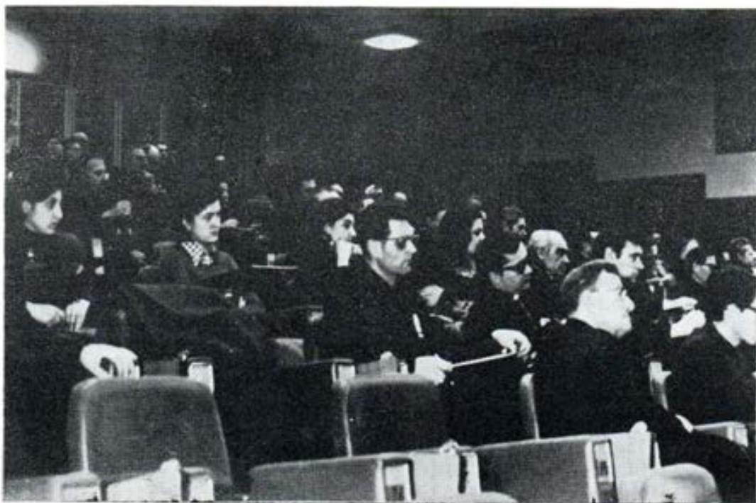
El salón auditorio del "Salesianum" de Roma tiene capacidad para 300 personas sentadas.