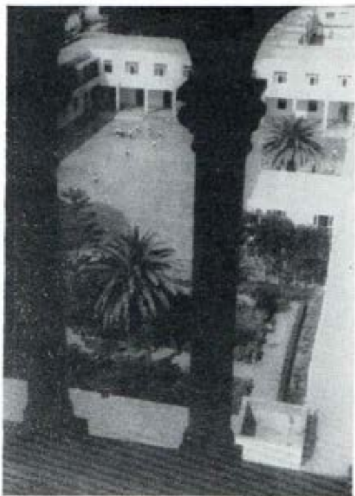
Patio principal del centro vocacional salesiano (aspirantado) de Magdalena del Mar, en Lima

Y aquí nos detenemos un instante: el aspirantado es centro de orientación voca-