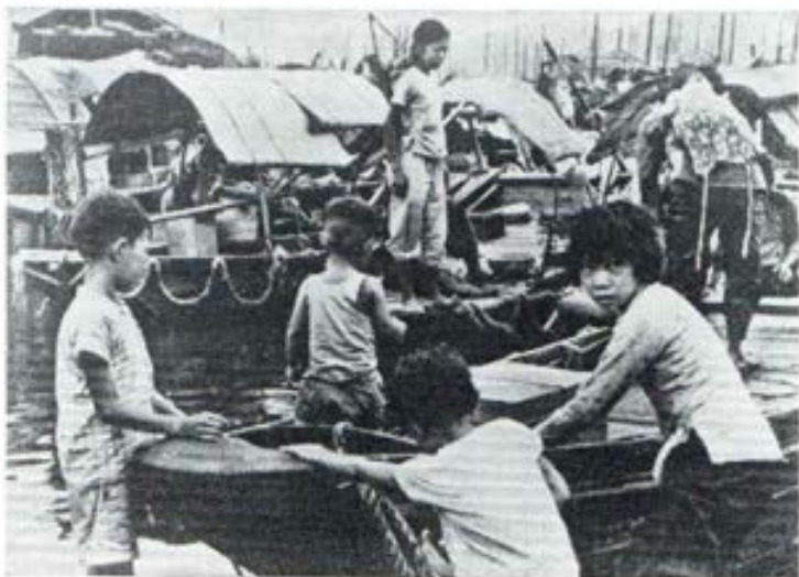
Hong - Kong (China) Niños de los "sampanes", barriadas flotantes donde viven millares de seres muy pobres, en pequeñas embarcaciones. Para ellos no hay lugar en el suelo firme de la tierra

Yo no llego a comprender a los hombres que se dicen ser cristianos y luego no dedican algún tiempo en la semana al apostolado asociativo. No querer dar un poco del propio tiempo puede ser, a veces, expresión del pecado de individualismo que hemos cometido por tanto tiempo.