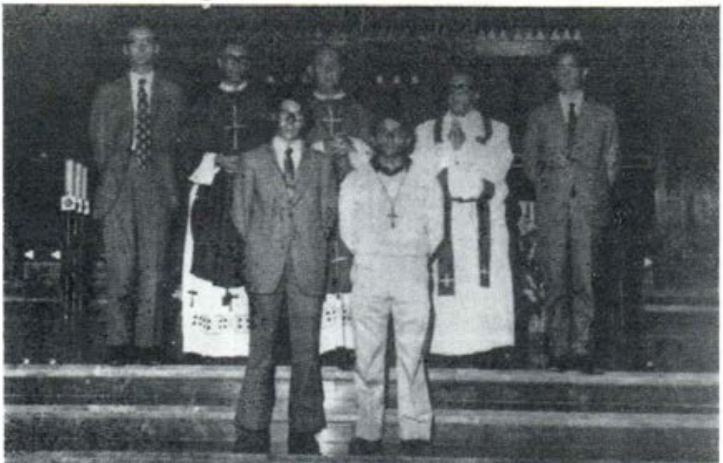
Los misioneros salesianos españoles que partieron para Africa

Había sencillez en todo pero mucha emoción en los corazones, trasuntada en los rostros. Asistían los familiares y amigos de los que partían. Todo parecía decirles: "La Iglesia, la Congregación y la familia respaldarán desde aquí, la obra que vais a llevar a cabo en lejanas tierras. Id de buen ánimo; os acompañamos de corazón".