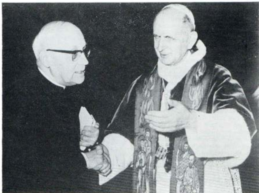
La Familia Salesiana, a través de su Rector Mayor, agradece al Papa la Beatificación de Don Rúa

Pero para nosotros, delante de Don Rúa, las palabras se hacen sencillas y elementales, pero no por esto menos dignas de consideración.