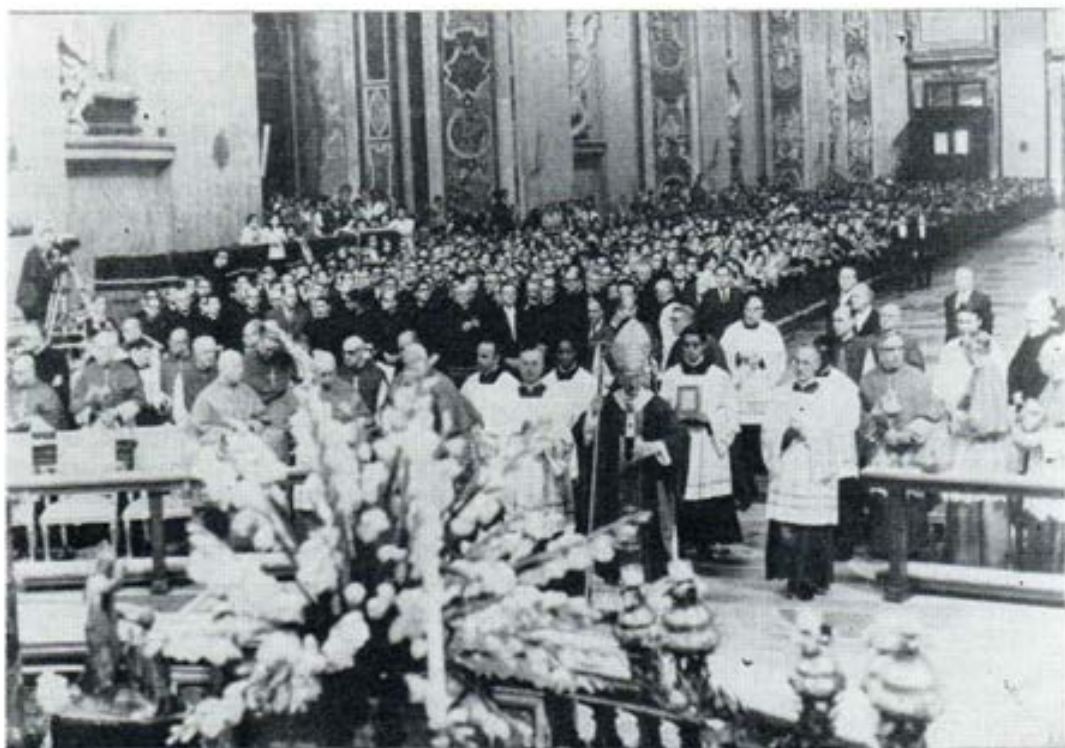
El Santo Padre Pablo VI llega a la Basilica Vaticana para el Solemne Pontifical del día de San Pedro. En las primeras filas se ven numerosos miembros del Capítulo General Especial salesiano

Desde las columnas del Boletín salesiano peruano queremos hacer llegar hasta el Vaticano nuestra voz, junto a la de Don Bosco, para decir al Padre de la cristiandad que lo amamos, y rezamos por El.