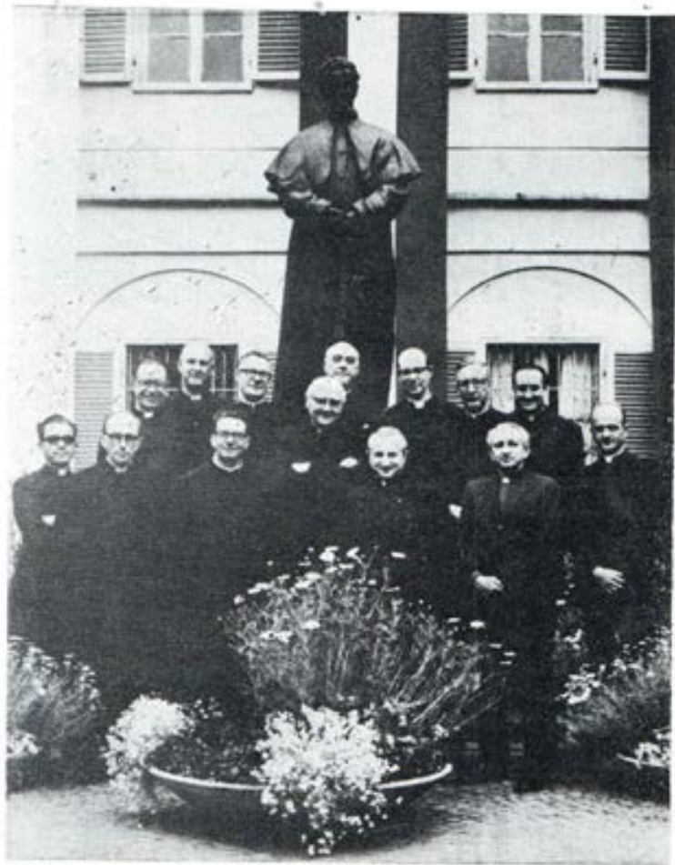
El Consejo Superior de la Congregación salesiana, posa ante la estatua de Don Bosco al dejar Turín para dirigirse a la nueva sede en Roma

Si el educador busca educar cristianos no puede salir de estos surcos. Si solo quiere hombres desligados de su fin sobrenatural, le bastará la psicología y las ciencias afines, pero al cabo de una o dos generaciones no tendrá tampoco hombres, sino pobres desorientados, alienados y vacíos a quienes nada ni nadie podrá llenar sus ansias de vivir feliz.