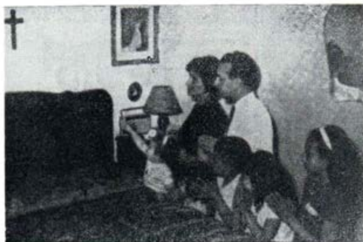
Cristo centro del hogar. La familia en oración comunitaria

4—Medios económicos, casa, etc... La miseria es siempre mala consejera, degrada y trae una incurable melancolía en todo el ambiente familiar. Pero las simples molestias del parto, de la incomodidad del embarazo, no son motivos válidos para restringir la natalidad. Ya