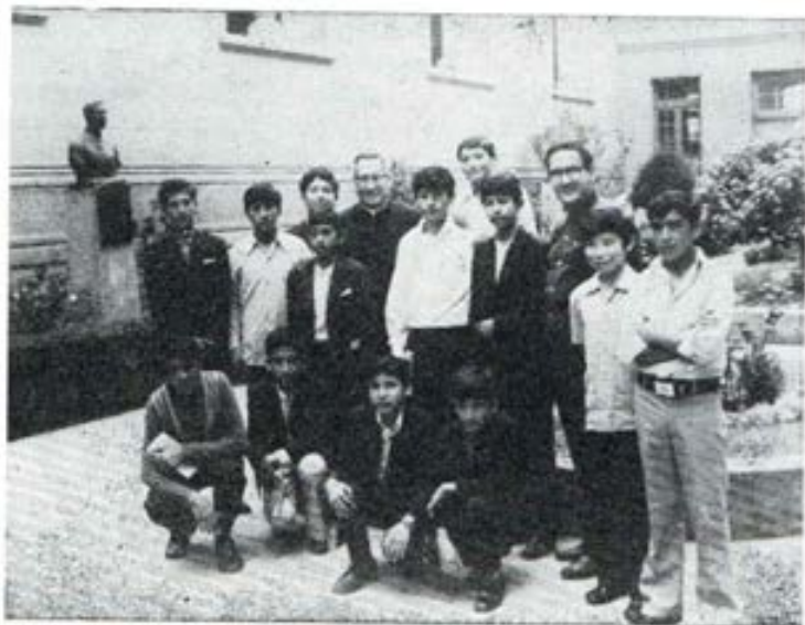
En el Colegio de Breña, el Rvmo. P. Inspector rodeado de aspirantes de la Casa salesiana de Ayacucho

3—La confianza otorgada a nuestra Asociación. Los Exalumnos, en efecto, son los responsables de su movimiento en la vida de la Iglesia, en el campo civil, en