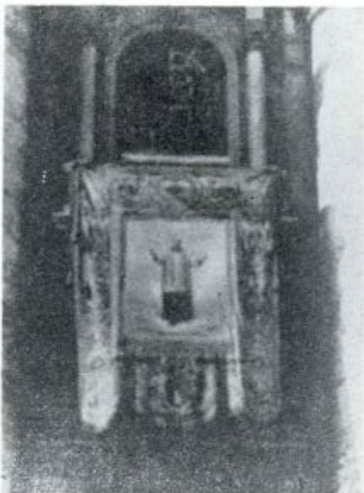
El frente de la Basílica de San Pedro, lució el día de la beatificación, un enorme óleo de Don Rúa

La tradición, que encuentra cultivadores y admiradores en el campo de la cultura humanística, la historia, por ejemplo, o el devenir filosófico, no está, en cambio, bien considerada en el campo operativo,