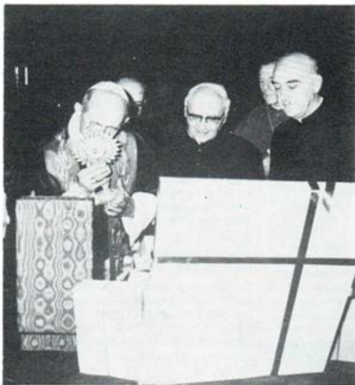
Pablo VI recibe la reliquia de Don Rúa que le obsequia el Rector Mayor y la besa. En esa ocasión, Don Ricceri obsequió además al Papa, la reciente edición de la Biblia en japonés y paramentos sagrados

miento: sea muy observante de las reglas. ¿Está contenta? Bien: todas las veces que lea esto, rezará un Ave María por el pobre Don Rúa. ¿De acuerdo?"