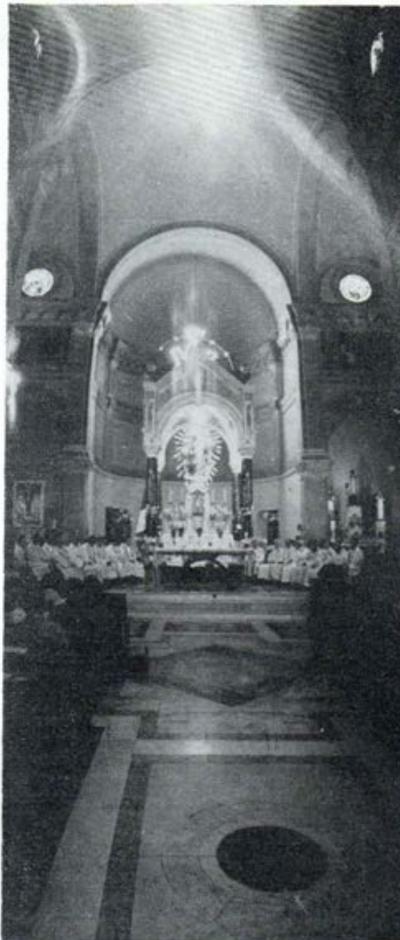
Una concelebración en la Basilica de María Auxiliadora de Lima

Es claro que si el mandamiento fuera divino, no cabría discusión al respecto. En efecto, los propios hombres son los que han declarado el celibato sacerdotal. Pero aún cuando esta política religiosa data de épocas remotas, lo mismo es válida en 1973 y con mayor fuerza todavía. Y es válida, no porque se quiera adoptar una posición atávica, sino porque sólo siendo célibe el sacerdote puede cumplir su misión en forma completa, y no a medias, como la cumpliría un sacerdote casado.