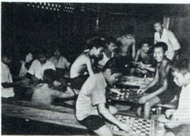
Thailandia - Bangkok: Alumnos artesanos de la escuela técnica salesiana, en un salón de juego

—Cuando lo merezca, corregid los errores del chico; pero jamás lo rechacéis a él. No hay ninguna contradicción en un papá que primero corrige a su hijo porque se porta mal y luego lo abraza con