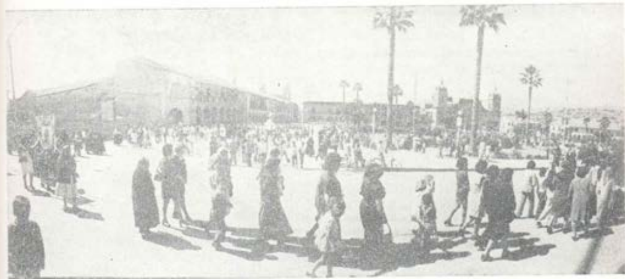
Un momento de la procesión de María Auxiliadora en Ayacucho el 24 de Mayo último. La población católica de la ciudad, demostró una vez más su amor y devoción a la Virgen de Don Bosco.