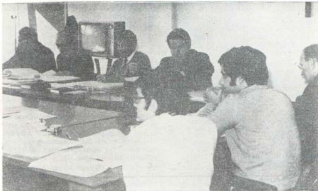
En el Salesianum de Roma, parte de la Comisión Internacional trabajando en la redacción del nuevo Reglamento para los Cooperadores.

La figura del Cooperador está esculpida en líneas espirituales que se pueden encarnar en todos los climas y en cualquier color de piel. Da la oportunidad al Cooperador de colocarse y cualificarse, por su fisonomía y tipo de actividad, de un modo inconfundible en el ámbito del asociacionismo católico. Un reglamento que se ofrece a los Cooperadores de todo el mundo para ser vivido y antes que todo, para ser meditado y rezado.