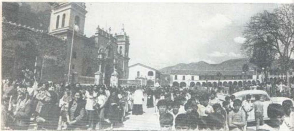
Otro aspecto de la procesión de María Auxiliadora celebrada este año en Ayacucho, con renovado fervor mariano.

Con el slogan "No estoy sola en el mundo, hay muchas otras personas", estas Exalumnas activas de María Auxiliadora de Venezuela van abarcando cada día más amplios horizontes de caridad y no se quedan en proyectos y reuniones y buenos propósitos, sino que las obras confirman y ratifican el anhelo ardiente que tienen de ser útiles al prójimo.