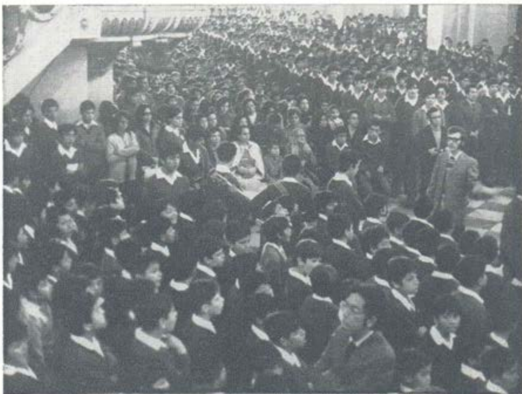
Multitud de colegiales y adultos asisten a la Misa concelebrada y a la peregrinación a la Basílica Catedral, con que la familia salesiana de Lima festejó el día del Papa.

La iniciativa surgió en 1972, cuando las Hermanas de la localidad invitaron a la población a la celebración del centenario del Instituto de las Hijas de María