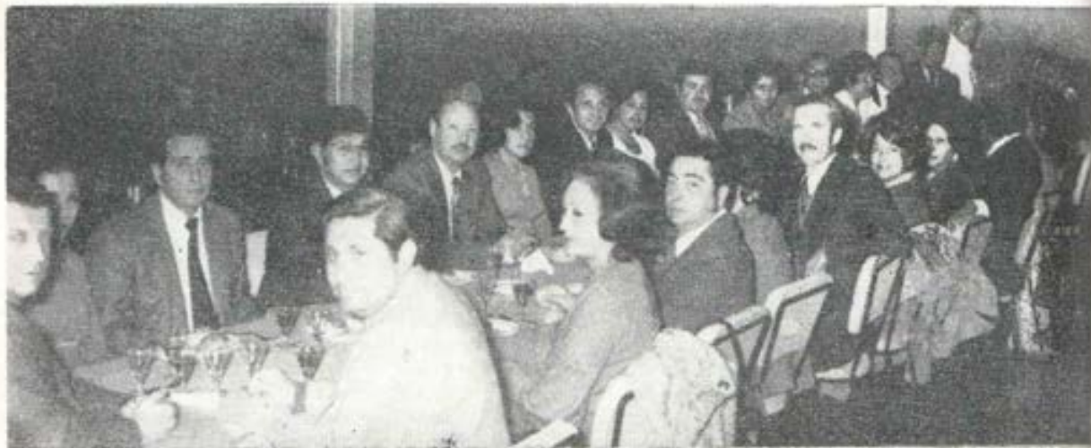
Exalumnos peruanos de la Promoción 1948 reunidos con sus esposas en una cena de camaradería.

Inesperadamente llega corriendo uno de aquellos demonios, señala con el dedo al director y grita: "¡ahora me las va a pagar todas juntas este curita! Y volviéndose a los otros revolucionarios: "A estos dos los tomo yo por mi cuenta, me los llevo a la plaza ahora mismo y los liquido". Llegan otros, arman una bahola ensordecedora y arrastran fuera a