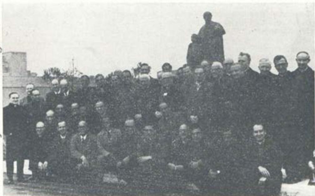
De la reunión mundial de Maestros de Novicios salesianos, celebrada en la Casa Generalicia en Roma, en Marzo último.

Concluimos nuestro inolvidable encuentro con la significativa celebración del Centenario de la aprobación eclesiástica de nuestras Constituciones, haciendo nuestras las palabras que Don Bosco dirigió al "maestro de los maestros", D. Julio Barberis: "D. Barberis, ha comprendido a Don Bosco".