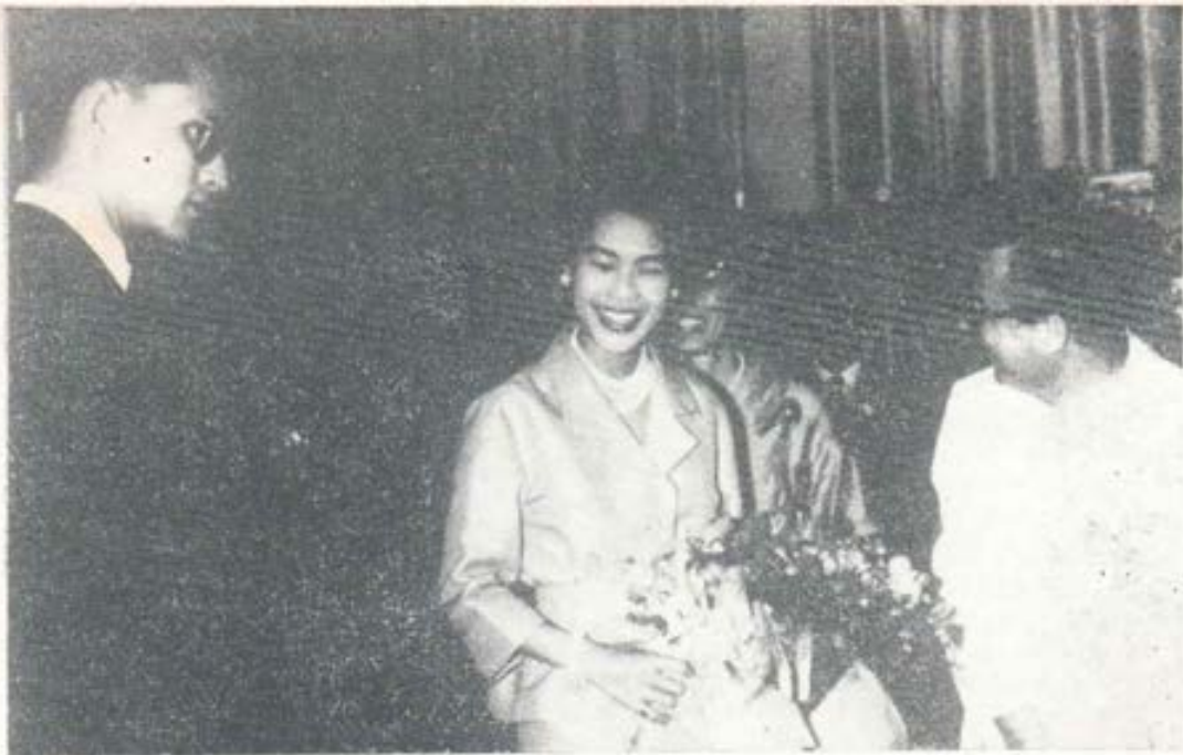
El Rey y la Reina de Thailandia, budistas, visitaron en 1962 la "Escuela técnica Don Bosco" de Bangkok y agradecieron a los salesianos su obra educadora. Aquí aparecen con el P. Inspector don Ruzzeddu.