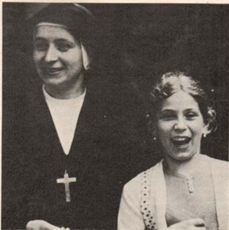
Dar testimonio con la propia vida

(Mensaje del Santo Padre para la Jornada Mundial de las Misiones Católicas).