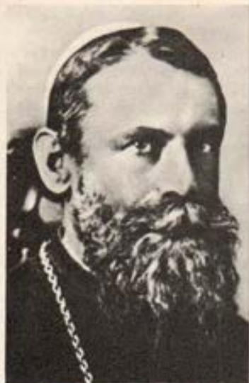
Mons. Luis Versiglia