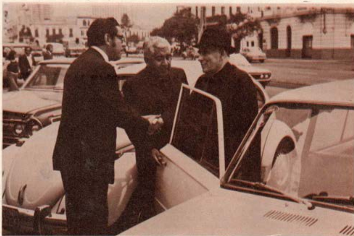
En la foto, el Cardenal Raúl Silva Henríquez, SDB, a su llegada a Lima

De "Solidaridad Internacional", profunda y sólida reflexión cristiana que sobre este tema hizo el Cardenal Raúl Silva Henríquez (Santiago) en el Encuentro "La Iglesia y el Proceso de Integración Andina" tenido en Lima del 30 de abril al 4 de mayo de 1976.