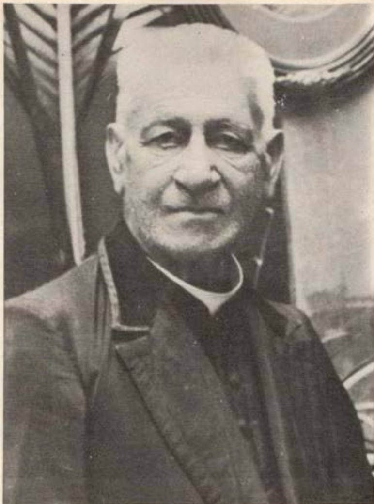
Padre Juan Pedro Rodríguez, primera vocación salesiana de América Latina (Uruguay).

el camino de las "Virtudes heroicas. Es éste una alegre noticia que viene a coronar el año del Centenario de las Misiones Salesianas, clausurado a fines de 1976.