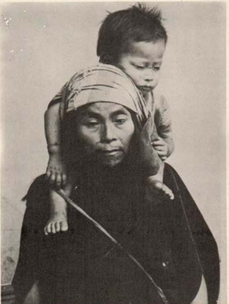
Nativos de Pampa Michi - La Merced.

CALLAO (NSP) Los alumnos de la Promoción "Don Bosco" del Callao han querido dejar como recuerdo en el templo Don Bosco un artístico altar, renunciando al tradicional baile de promoción, anillos y banquete. La significativa placa: "DON BOSCO PROTE-