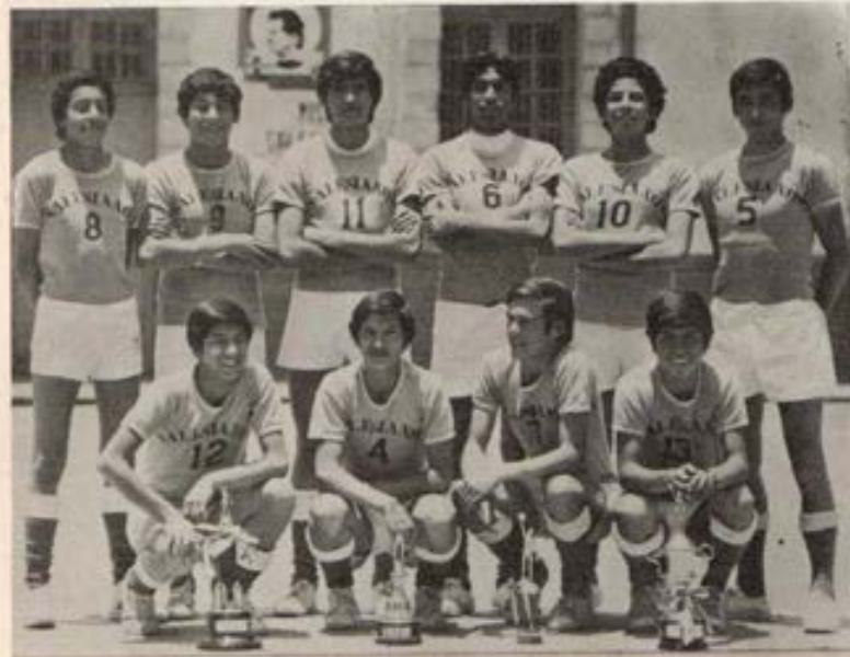
Equipo Campeón del Colegio Salesiano - Cuzco.