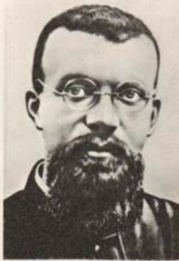
Padre Calixto Caravario

Al sacar a Don Caravario, la mano de Mons. quedó al descubierto. El sol quemaba y me parecía que el corazón quería paralizarse, habría querido dejar un rato el trabajo para reposar, pero continué desenterrándolo en la misma forma que a Don Caravario. Se cortaron sus ataduras, besé su fren-