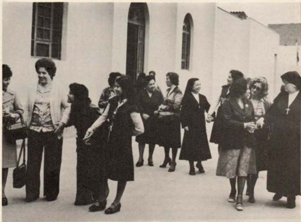
Las Exalumnas durante una de las jornadas que prepararon el encuentro nacional el 30 de Enero de 1977.

Pero he aquí que llega el tío Miguel. Habla con la hermana y ya vemos a Juan en casa del capellán de Chieri, Don José Calosso, entregado al estudio y al trabajo, después en Murialdo, luego de nuevo en Chieri. ■