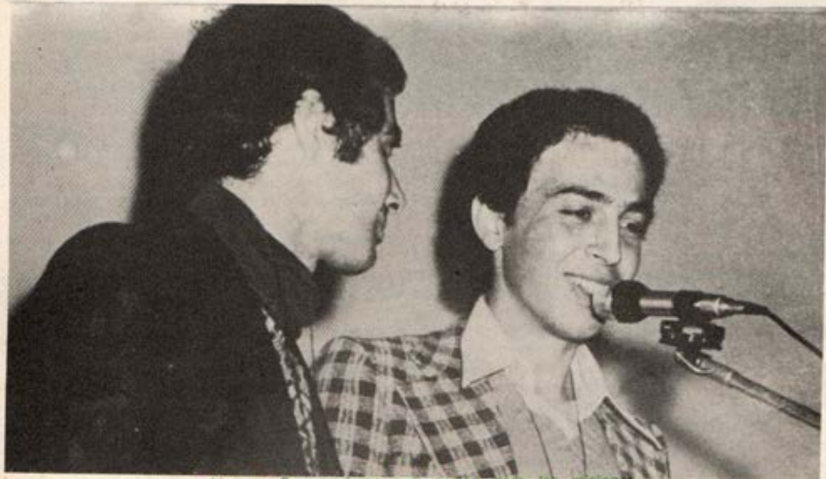
Jóvenes Cooperadores que parten para las misiones

Quiera el Señor bendecir este humilde pero significativo comienzo, como bendijo el gesto proféticamente audaz de Don Bosco cuando envió sus primeros diez misioneros a la América.