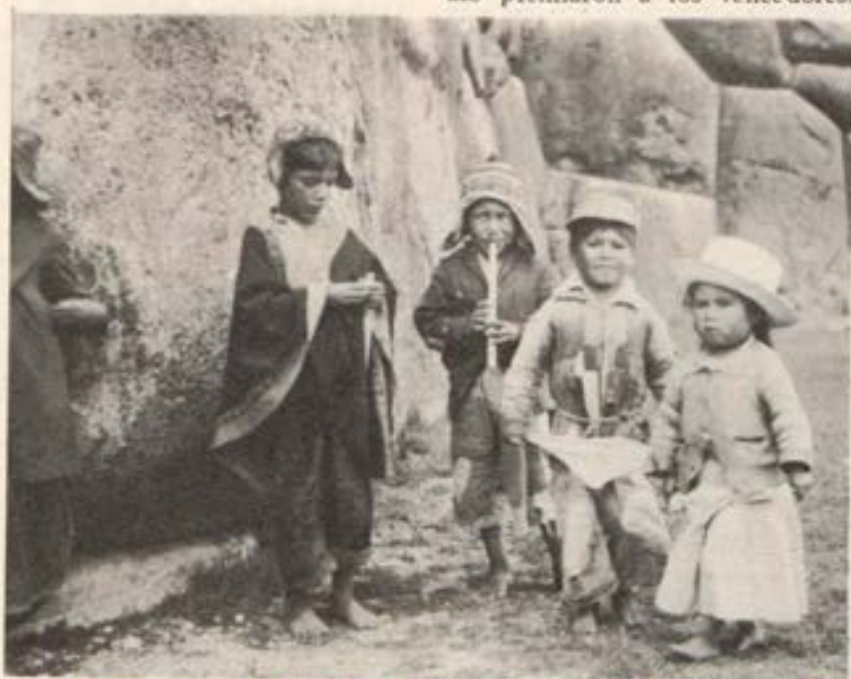
Niños cuzqueños ante la fortaleza Incaica de Sacsahuamán.

Todos participaron en la fiesta, chicos y grandes. Si hubieran ve-