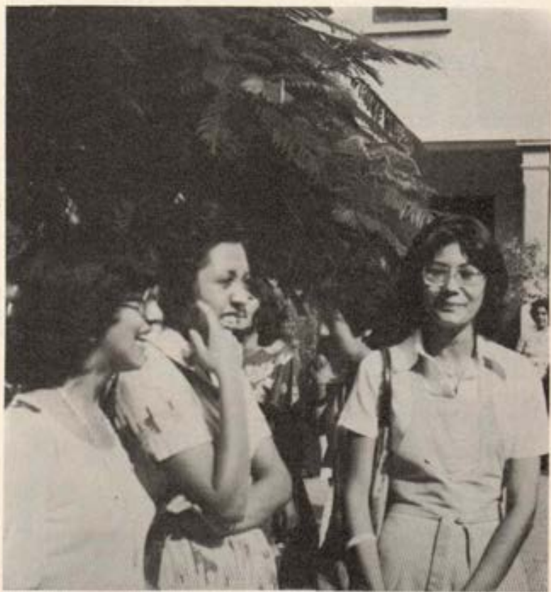
Exalumnas de las Uniones de la Inspectoría en la Jornada Nacional.

Estos días de fraternidad prepararon el encuentro del día Central (Domingo 30 de enero) al que asistieron numerosas exalumnas de las diversas Uniones de la Inspectoría, gozando de una jornada totalmente salesiana, viviendo momentos de alegría y amistad entre exalumnas y antiguas maestras.