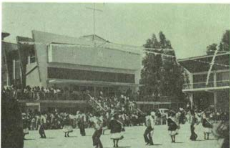
Folklore huanca en el Patio del Colegio.