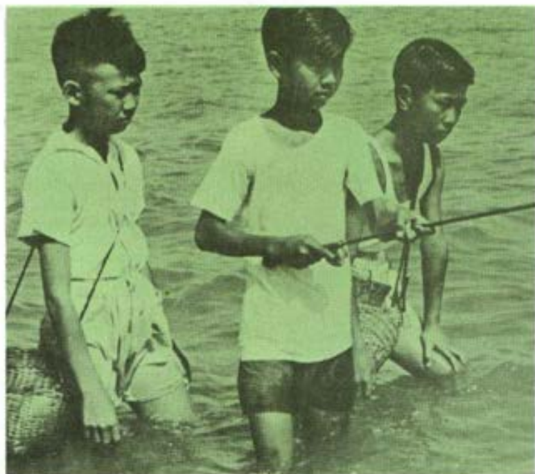
MACAU.- Los Pescadores de Yuet-Wash.- Tiempo libre de los alumnos del Colegio Salesiano.

dos de casas. Vivimos en tiendas facilitadas por el ejército brasileño, a 4 km. tierra adentro. Las Hijas de María Auxiliadora, heroicamente nos echan una mano. Todas las casas de los Moros quedaron destruidas por las furiosas aguas. Cultivos recientes, y campos de frutales han desaparecidos. Si dentro de cuatro o cinco meses las aguas no vuelven a su cauce, deberemos comenzar todo, desde el principio. Sin embargo, vamos dando ánimos a nuestros indios y ellos se sienten seguros con nosotros". Este un auténtico grito de alarma, un SOS., que nos llega desde las riberas del impetuoso río Paraguay. Las buenas palabras del corazón no bastan para quitar el hambre a colonos e indios casi totalmente aislados, sólo comunicados por vía fluvial a decenas y decenas de horas de aguas arriba desde Asunción. Así viven con su gente, en las orillas de los ríos y de las selvas nuestros misioneros.