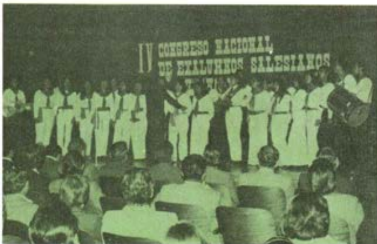
La Tuna Universitaria en una de sus presentaciones.

4).- Para que estas acciones tengan realización efectiva se requiere el apoyo decidido de la comunidad salesiana en pleno y no solamente del delegado salesiano. ■