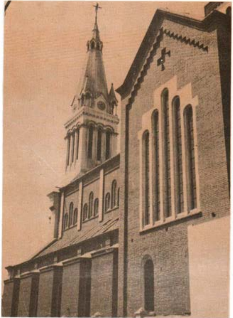
Una vista del hermoso Templo dedicado a San Juan Bosco.

Con este motivo accediendo a su amable invitación, tendré la oportunidad de asociarme a Ud. y a sus feligreses en el canto de alabanza y de agradecimiento al Señor por los dones derramados durante estos cinco lustros de existencia y de actividad. Deseo también expresarle mi más sincera congratulación