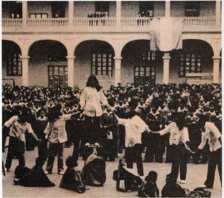
Celebrando el día del Papa - Colegio Salesiano de Lima 1979.

2.- EXAMINAR con visión de Pastores, algunos aspectos del actual contexto socio-cultural en que la Iglesia realiza su misión y, así mismo, la realidad pastoral que hoy se presenta a la Evangelización con sus proyecciones hacia el futuro.