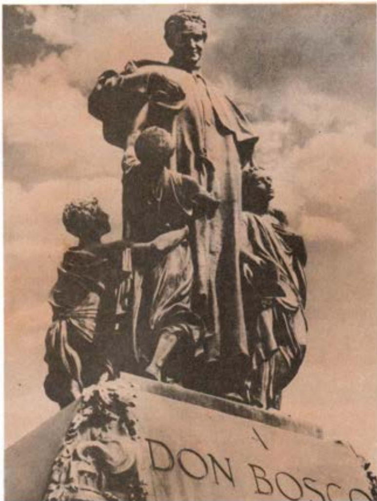
Turin.- Monumento a Don Bosco

—¡Mis ayudantes se han ido y me han dejado sólo en medio de tantos niños; yo me hallo sin fuerzas, mi salud ya está gravemente minada; todos me persiguen: no encuentro quien me ayude, por añadidura, dentro de dos horas termina el plazo de mi permanencia en este lugar. Necesito otro lugar para poder