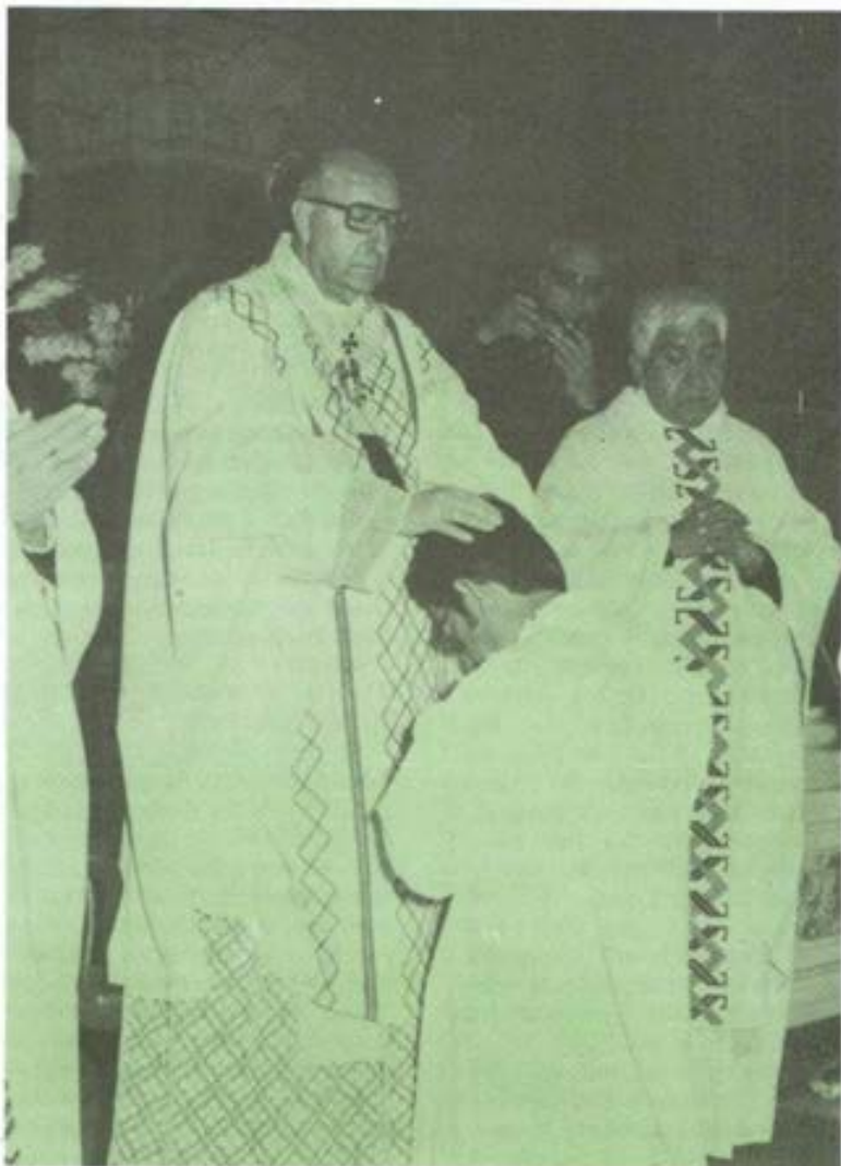
El Señor Cardenal, Juan Landázuri Ricketts; aquí en la Basílica de María Auxiliadora, en la última Ordenación Sacerdotal de Salesianos.

sus actos, en la rectitud de su trayectoria, en la firmeza de sus convicciones en la claridad de sus objetivos, me ha mostrado la vida y el ministerio pastoral como un todo coherente, no obstante la multiplicidad de los trabajos, la adversidad de las situaciones y la complejidad de los problemas.