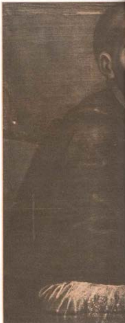
SANTO TORIBIO ALFONSO DE M ña) el 15 de noviembre de 1538. Fu hasta su muerte ocurrida en el pueb el único beatificado por el Papa Be canonizado por el Papa Benedicto X León XIII extendió su fiesta a tod

La vida del Santo Arzobispo recobra una admirable actualidad. En aquella época de consolidación y de despegue, Santo Toribio construye una organización sólida y desarrolla una actividad evangelizadora, basada en un conocimiento directo y detallado de la realidad global y de la problemática concreta en la casi incipiente Iglesia debía cumplir su misión. Ahora ante la crisis generalizada y la profunda mutación que caracteriza nuestra época, la Iglesia Universal y, más concretamente, la Iglesia latinoamericana realiza grandes y acertados esfuer-