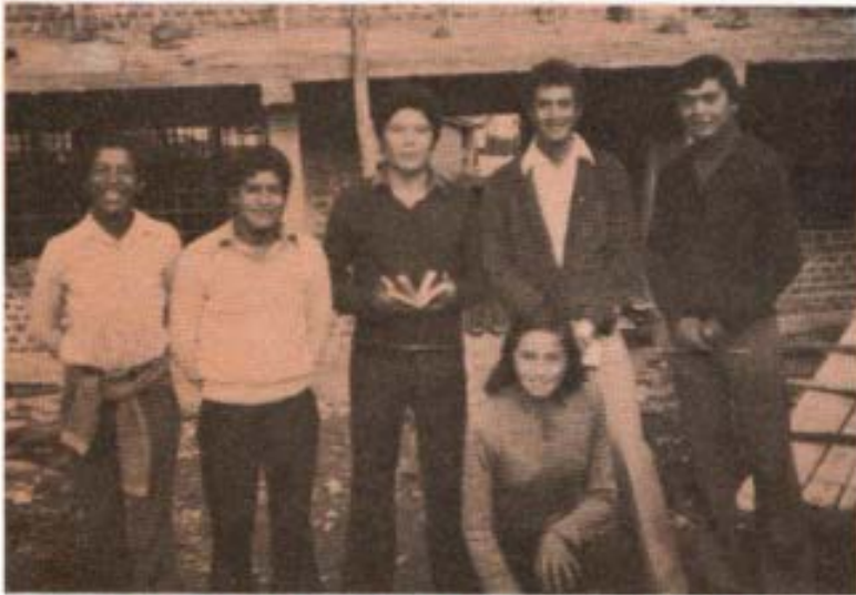
Jóvenes catequistas de Andahuaylas, trabajan con los Hermanos en el Oratorio, Centro Juvenil y colaboran en la organización y realización de campamentos, jornadas y cursillos.