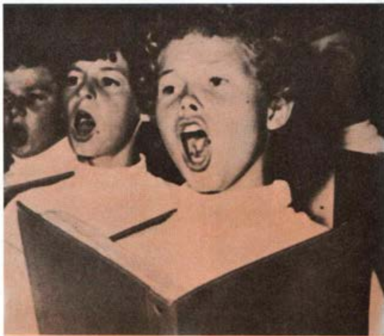
Niños cantores de Ens Dorf - Alemania.