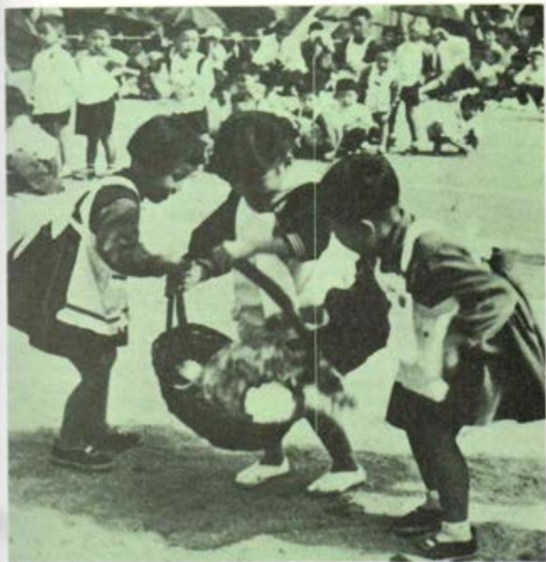
NAKATSU, Japón.- Niños felices celebrando el día de la Madre, misterio de vida, de amor y de esperanza

De todos modos, el hecho de que los valores y las instituciones culturales y las ciencias antropológicas tengan una consistencia y una finalidad propias exige que, en el Sistema Preventivo, se dé un margen más amplio a las iniciativas y a las instituciones culturales, de acuerdo con la actual "condición juvenil" armonizándolas oportunamente dentro de una propuesta de educación integral.