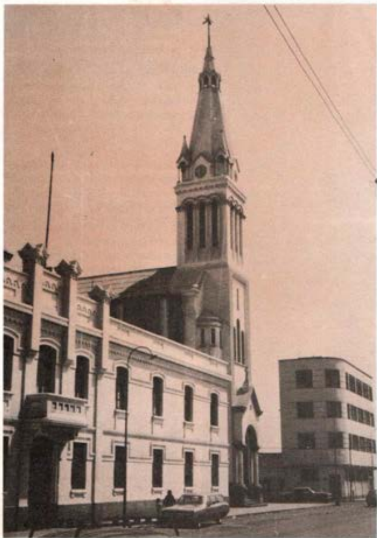
El Colegio, el Templo en honor de Don Bosco y el Edificio para las obras sociales.

chalaco y todos los años nos vemos obligados a rechazar gran cantidad de matrículas por muchos pedidos.