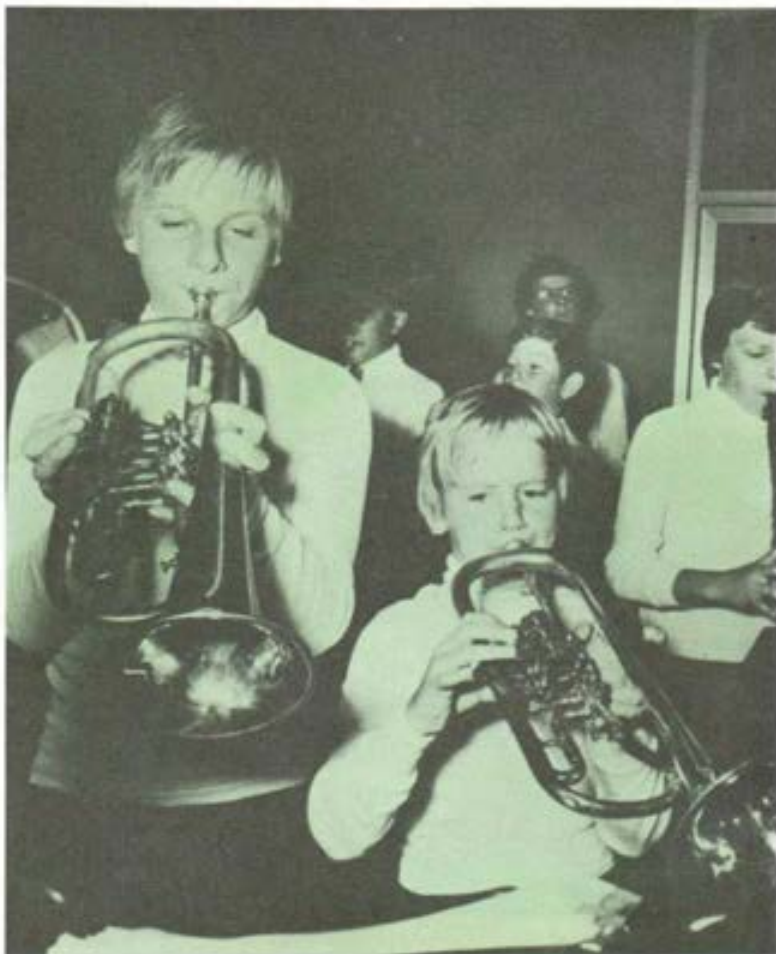
Jóvenes músicos alemanes.

En la clausura, Don Giovanni Raineri indicaba los siguientes puntos positivos: la "novedad" ("por primera vez nos hemos sentado juntos a reflexionar...");