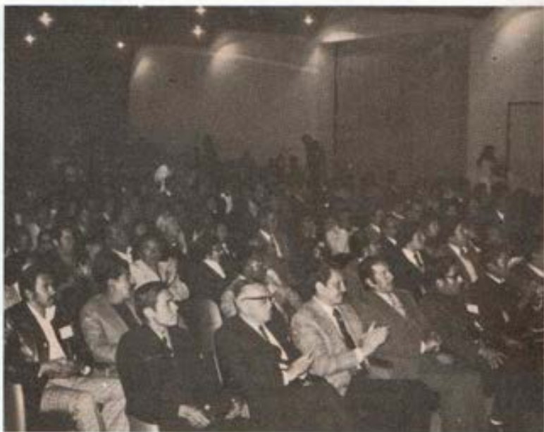
Una vista de la Asamblea Plenaria del Congreso.

Uniones, algunas UES, tienen problemas con sus sedes, por ejemplo la de Arequipa. En estos casos se sugiere dirigirse al Comité Ejecutivo de la FEPEXS.