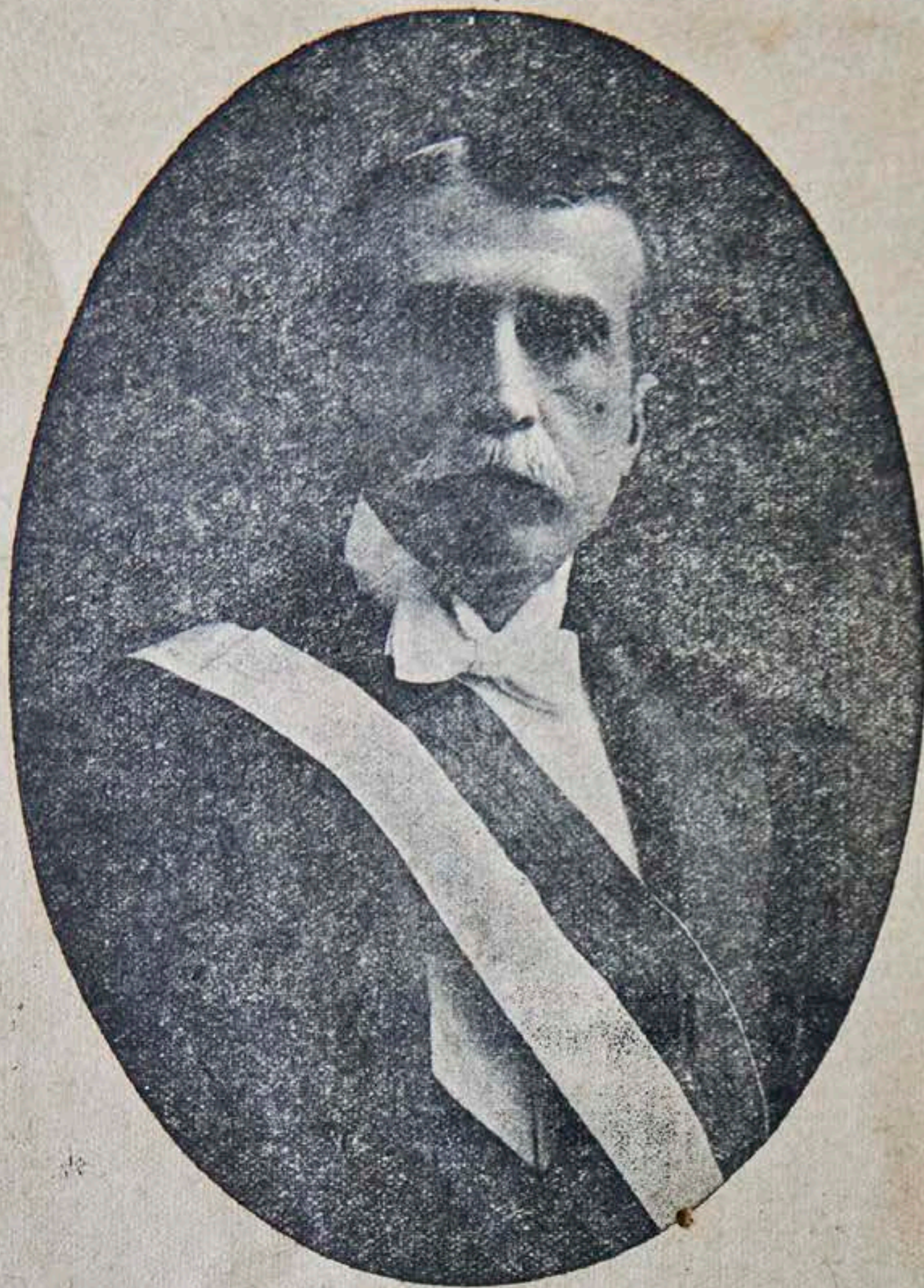
Excmo. Sr. Augusto B. Leguía