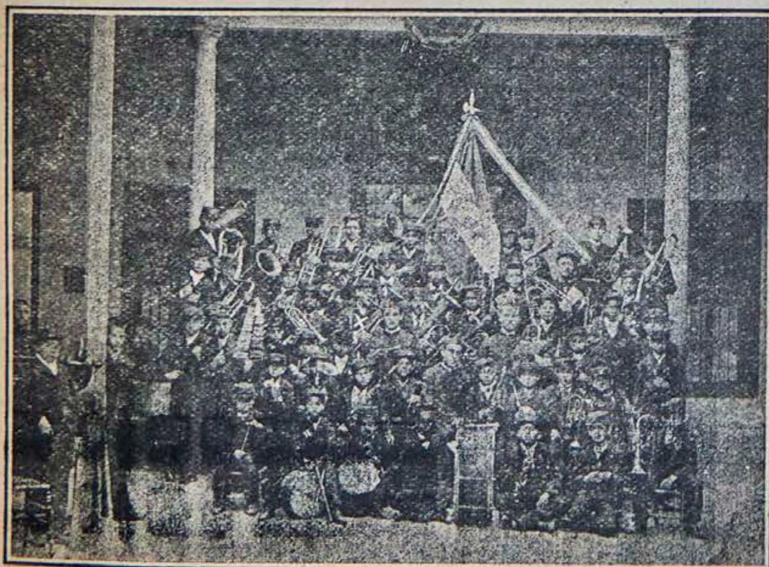
La banda del Colegio Salesiano en el año 1894.

Esta diócesis es una de las más vastas del