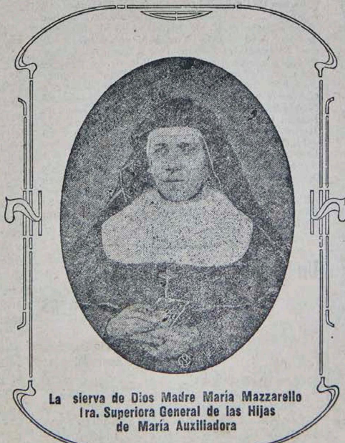
La sierva de Dios Madre María Mazzarello Ira. Superiora General de las Hijas de María Auxiliadora