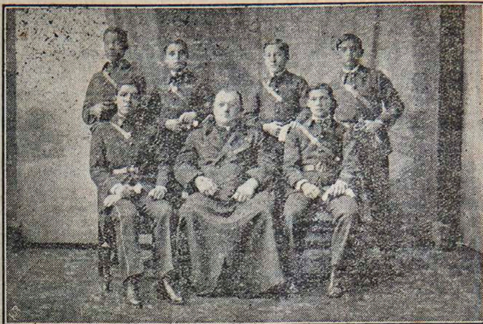
Curso Superior — Sección Artes y Oficios

Nuestro amigo y buen ex-alumno contraerá matrimonio próximamente en la Capilla de María SS. Auxiliadora. Le auguramos un feliz hogar,