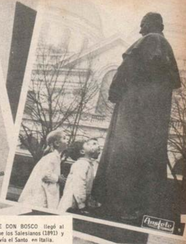
LA FAMA DE DON BOSCO llegó al Perú antes que los Salesianos (1891) y viviendo todavía el Santo en Italia.

DON BOSCO. OBRA ESCRITA EN FRANCÉS POR EL Dr. CARLOS D'ESPINEY. VENTIDA AL ESPAÑOL DE LA CUARTA EDICION POR EL P. A. T. MONEDERO DE LOS HERALDOS DE LIMA. "Londra por Navarre, Sellers de los Bazaros." CON LA DEBIDA APROBACION. LIMA CARLOS PRINCE IMPRESOR Y LIBREERO-EDITOR Calle de la Versalles, 11. 1885.