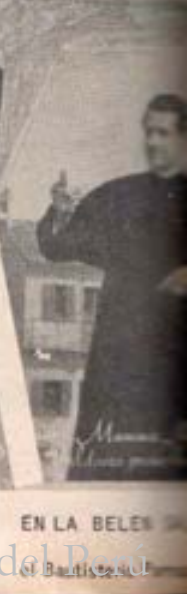
EN LA BELEN