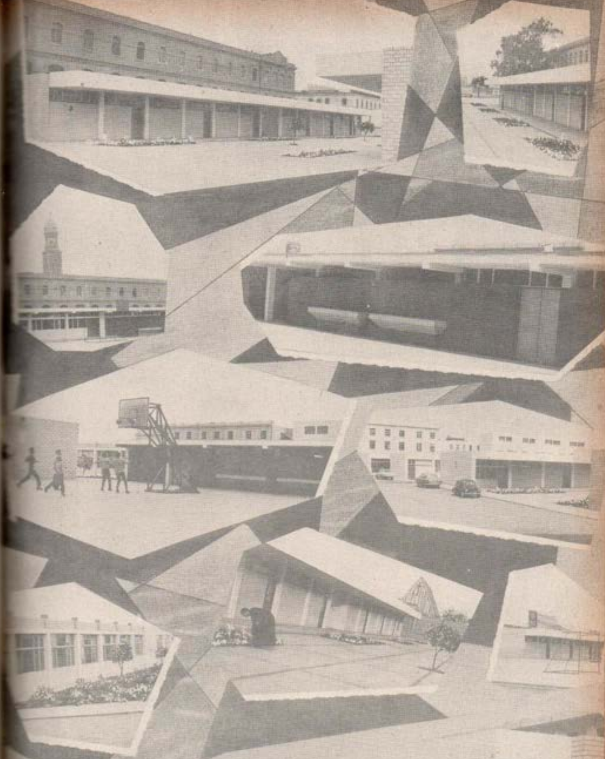
BREÑA - LIMA COLEGIO SALESIANO NUEVO LOCAL