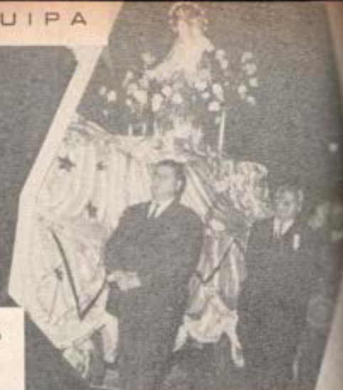
Fiesta de María Auxiliadora en el Colegio Don Bosco * Avanza la construcción de la nueva iglesia de M. Auxiliadora.