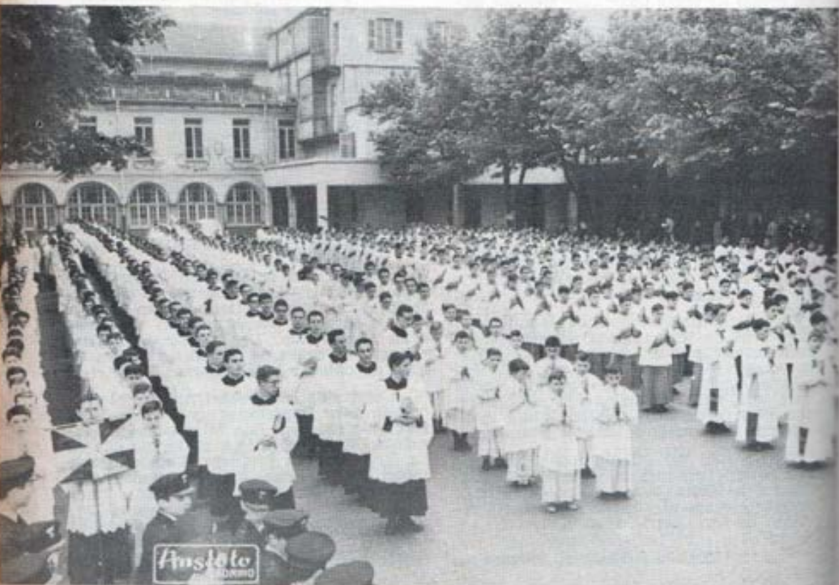
TURIN (ITALIA).- Concurso del Pequeño Clero entre Colegios Salesianos. Las Funciones Litúrgicas tienen mucho esplendor con la piedad de los Acólitos