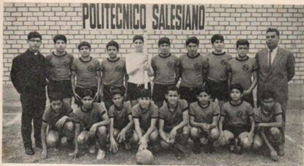
Campeón en la Liga de Colegios Religiosos de Lima.

traducción del nuevo ritual del bautismo para todas las zonas quechuas. (Aunque esto se ha estado realizando a modo de experimento y con grandes resultados en el Departamento de Apurímac). Así mismo la traducción del nuevo ritual del matrimonio que a partir de ahora se pondrá en práctica en la zona de Ancash.