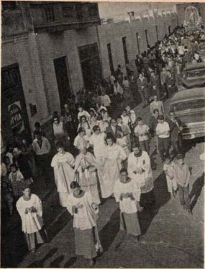
Procesión de María Auxiliadora en el Rímac - Lima