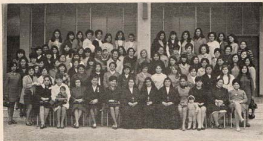
Día del Colegio de las Exalumnas de María Auxiliadora del Prado. Lima