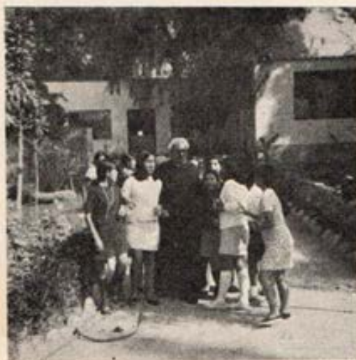
Las Oratorianas de Breña en el retiro de chacacayo gozan de un rato de expansión.