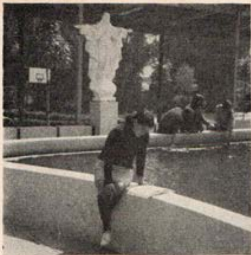
Las Oratorianas de Breña en Retiro. Chacacayo