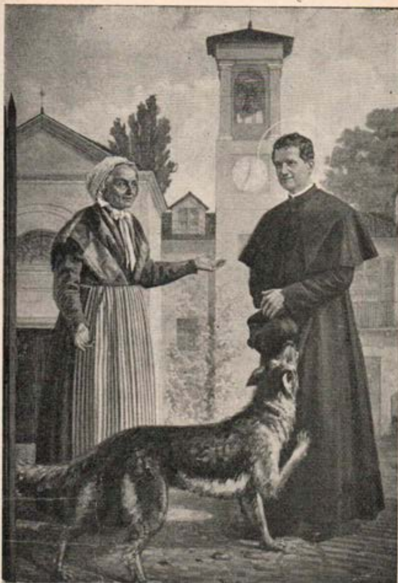
El Gris, perro misterioso que muchas veces defendió a Don Bosco.

Sin perder tiempo tomaron el tren y apenas llegados a Turín se informan y corren a Valdocco, la casa de Don Bosco. En esos momentos el santo se halla departiendo con Don Miguel Rua y el Padre Berto, que serán testigos; en presencia de ambos recibe al matrimonio marsellés.