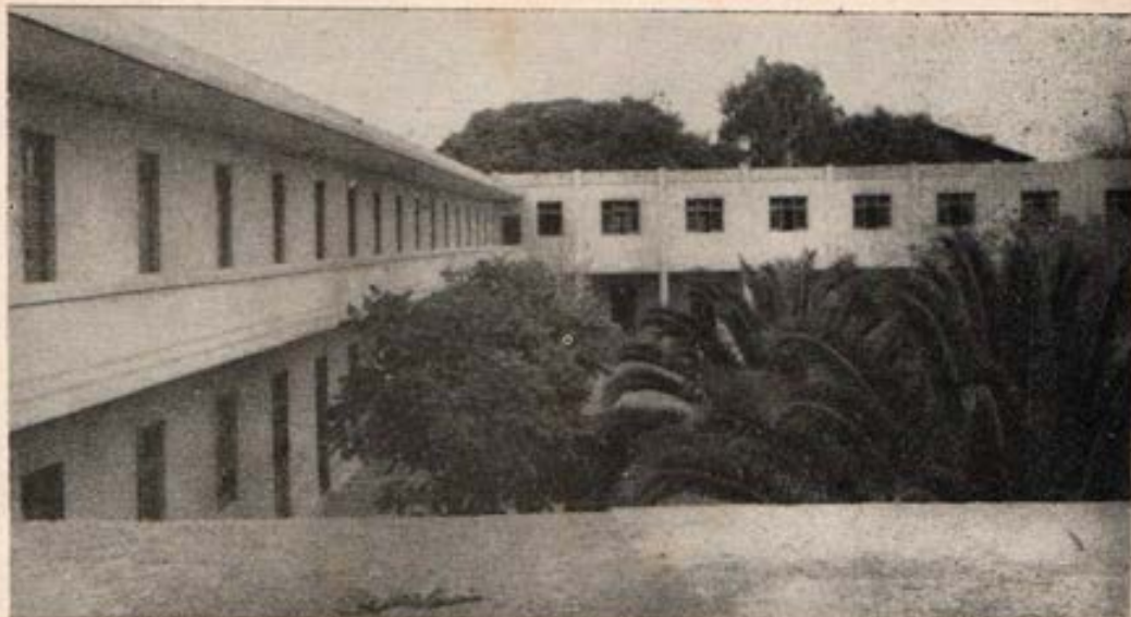
Aspirantado de Magdalena del Mar.

da a ellos. Trabajan. Conocen mejor la Congregación y sus fines, estudian las Constituciones que han de ser la norma de su vida y ejercen un apostolado de catequesis en los pueblos cercanos.