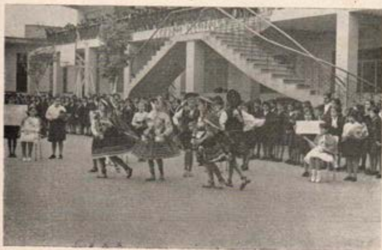
Festejando a las Reinas de la Bondad en el Colegio M. A. del Prado.