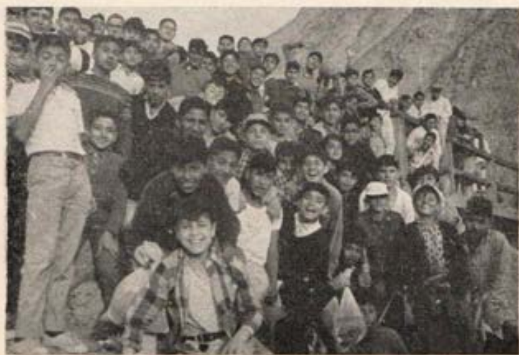
Los aspirantes de Magdalena del Mar en un paseo a los cerros.