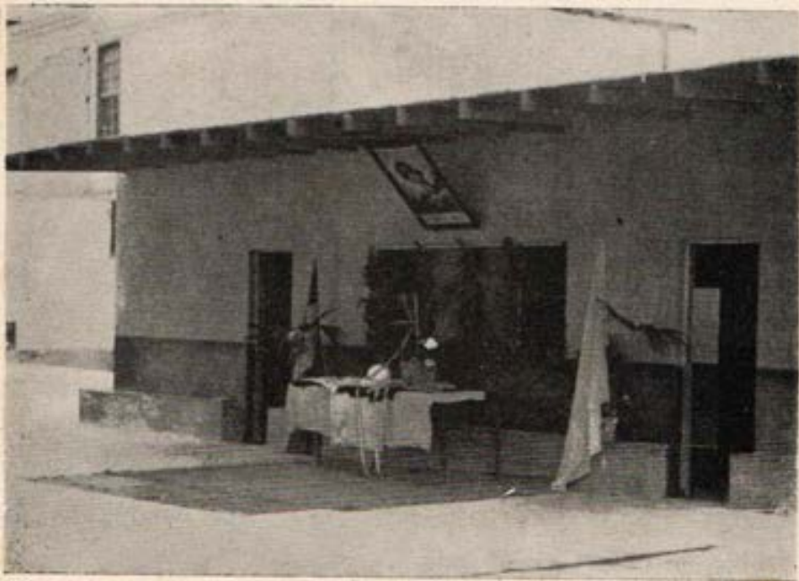
El primer Oratorio salesiano del Perú en el Rímac - Lima