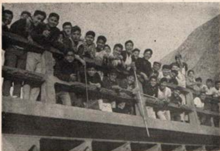
Don Bosco quería en sus colegios, rostros alegres