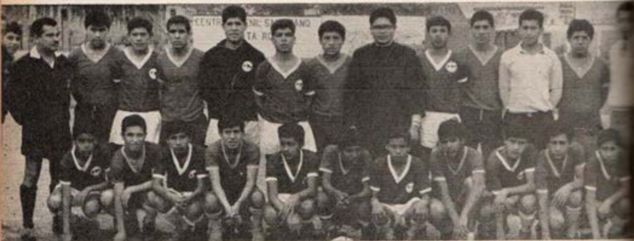
Campeones del Centro Juvenil de Lima.

Toda la Iglesia debe estar en estado de misión. Es menester irradiar la fe. Cada cristiano debe sensibilizarse, decidirse y aportar su contingente, según la medida de sus fuerzas.