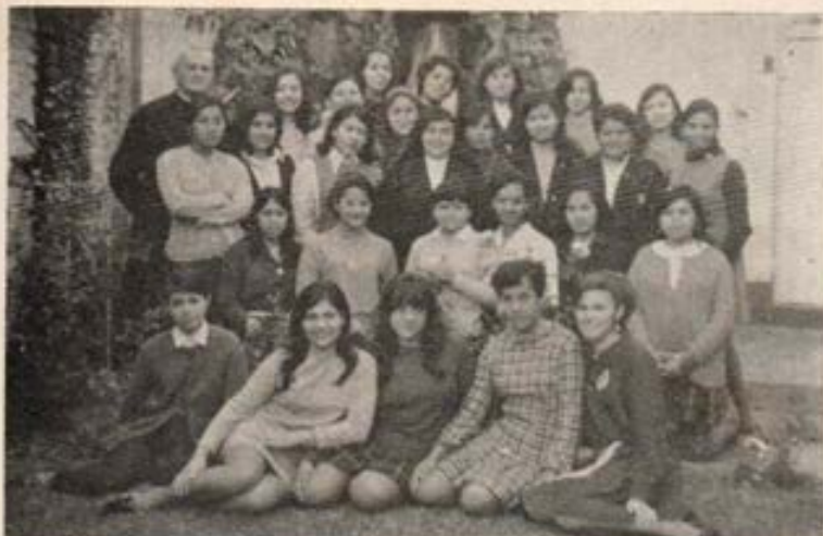
Exalumnas que hicieron el Retiro espiritual en Chaclacayo. Colegio del Prado.