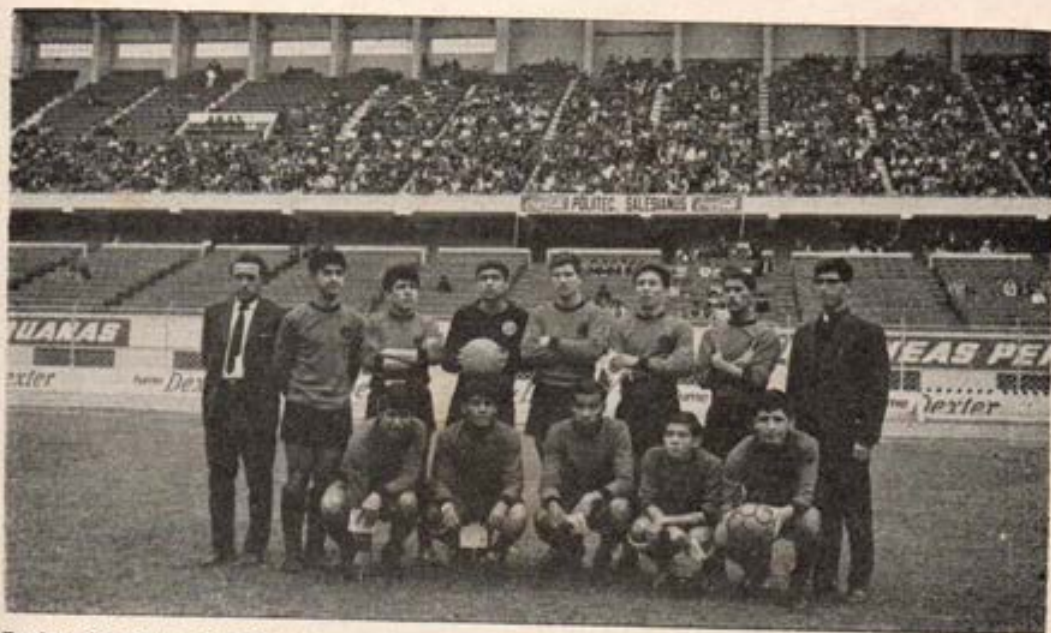
Equipo del Politécnico Salesiano, sub campeón de Interclubes de Lima y Callao

Saluda con afecto filial al Exmo. Señor Nuncio y le asegura una adhesión plena y la oración permanente de los Cooperadores, Exalumnos, Salesianos y Alumnos de la Familia salesiana.