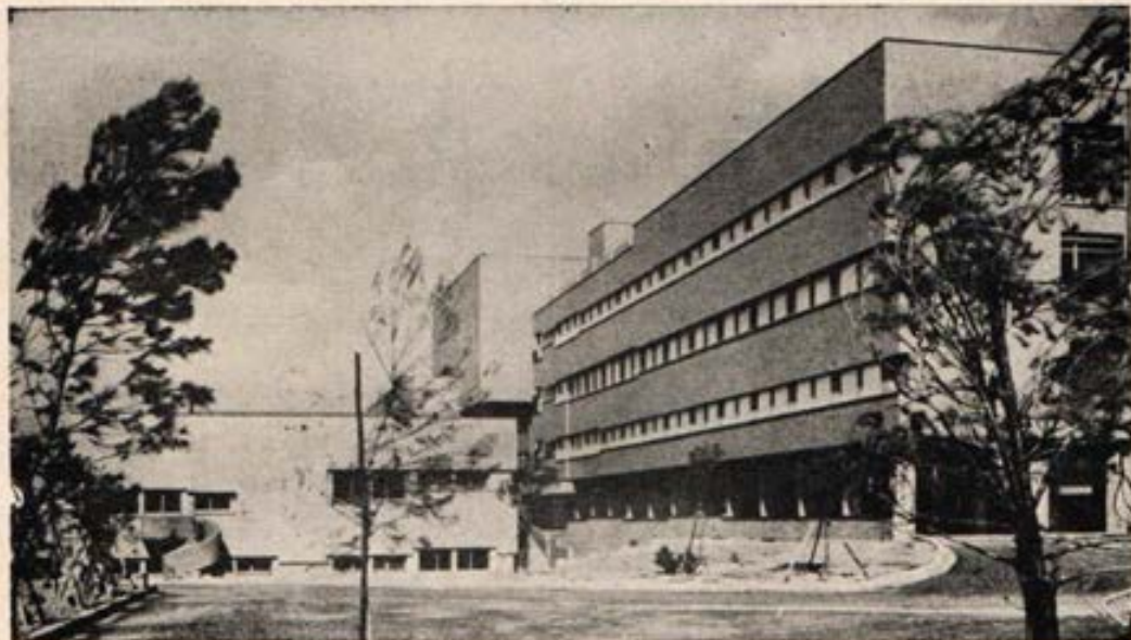
Nueva Sede de la Dirección General de las Hijas de María Auxiliadora, en Roma.

No olvide: El Perú necesita sacerdotes y Ud. puede ayudar a formarlos.