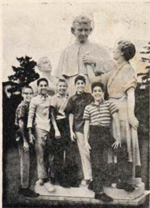
Los Hijos junto a la imagen del Padre

—Además, mi madre debe estar esperándome en casa.