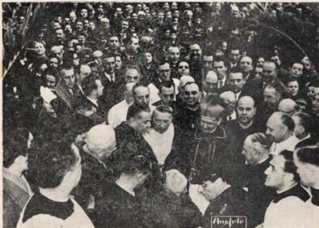
Un Pueblo unido con su Pastor

Corinto era una ciudad corrompida. Y había muchos corintios que eran cristianos. Entonces Pablo para enseñarles que ellos no deben seguir las costumbres perversas de sus connacionales, les dice que no pueden hacer actos nefandos porque se han hecho un solo cuerpo con Cristo. (I Cor 6, 16).