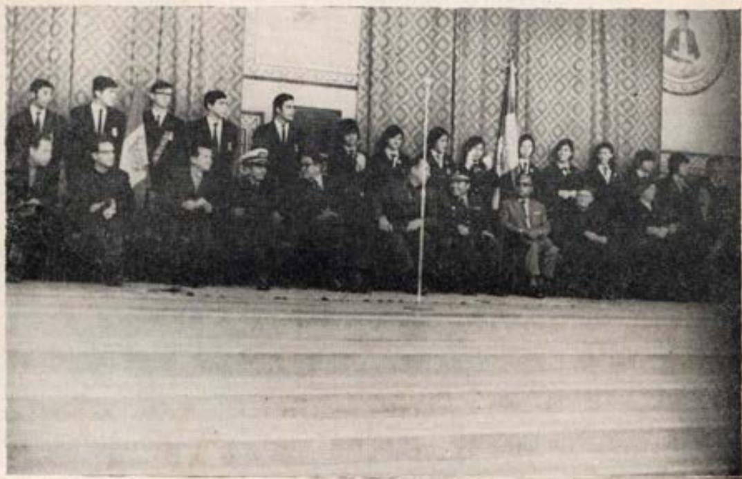
Autoridades Civiles y Militares presidiendo el homenaje al sesquicentenario de la Patria en el Politécnico Salesiano