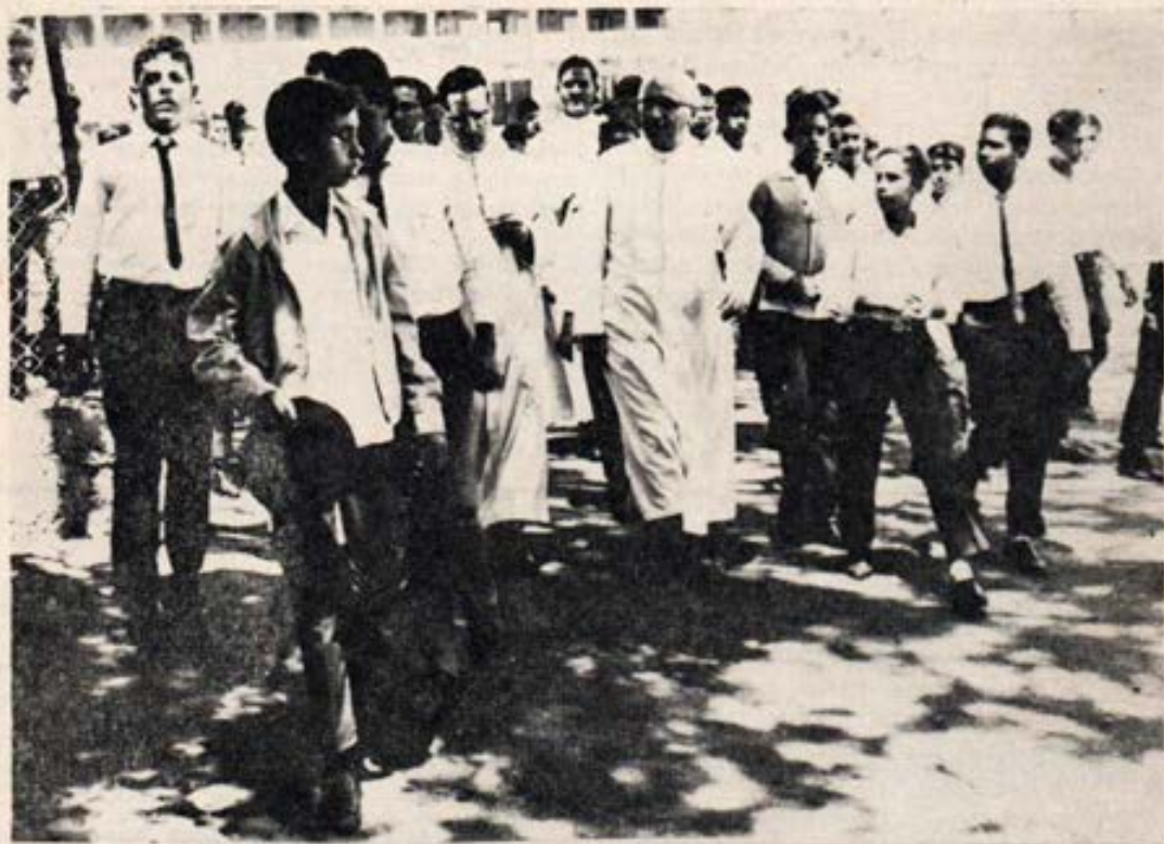
Juventud vibrante llena de ideales nobles

Sus deficiencias son muy reales. Aunque sus mayores tiene parte de la culpa, sería negar la libertad de elección de la juventud si no reconociéramos que los jóvenes son responsables de sus acciones.