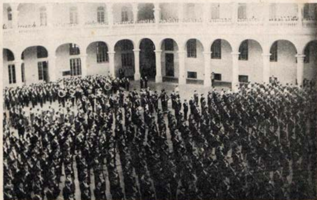
Numerozo alumnado de la obra salesiana en Breña en compacta formación recordando los 150 años de independencia