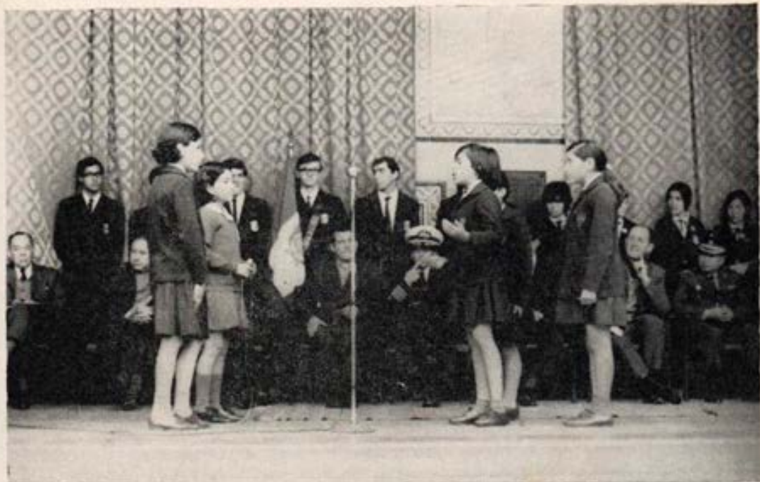
Estrado de honor del Politécnico Salesiano en las fiestas sesquicentenarias