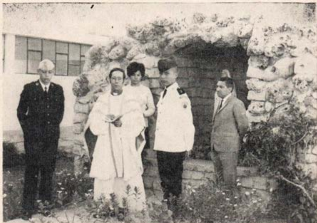
Bendición de la gruta a la Inmaculada en el Colegio Militar "Elias Aguirre" de Chiclayo