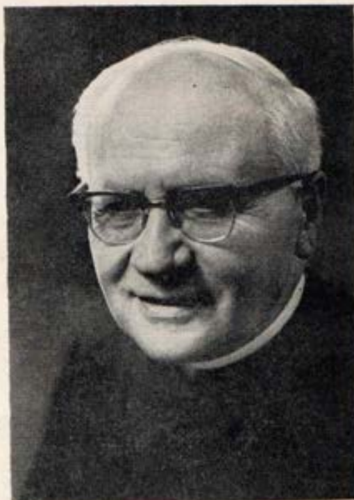
Don Luis Ricceri Rector Mayor de los Salesianos

Han pasado 6 años. En el mundo ha explotado, clamorosa, la contestación juvenil que ha puesto en un primer plano a los jóvenes. Es un nuevo estado social y una fuerza que sacude los fundamentos de las viejas estructuras y que ha creado el deseo de un mundo más justo.