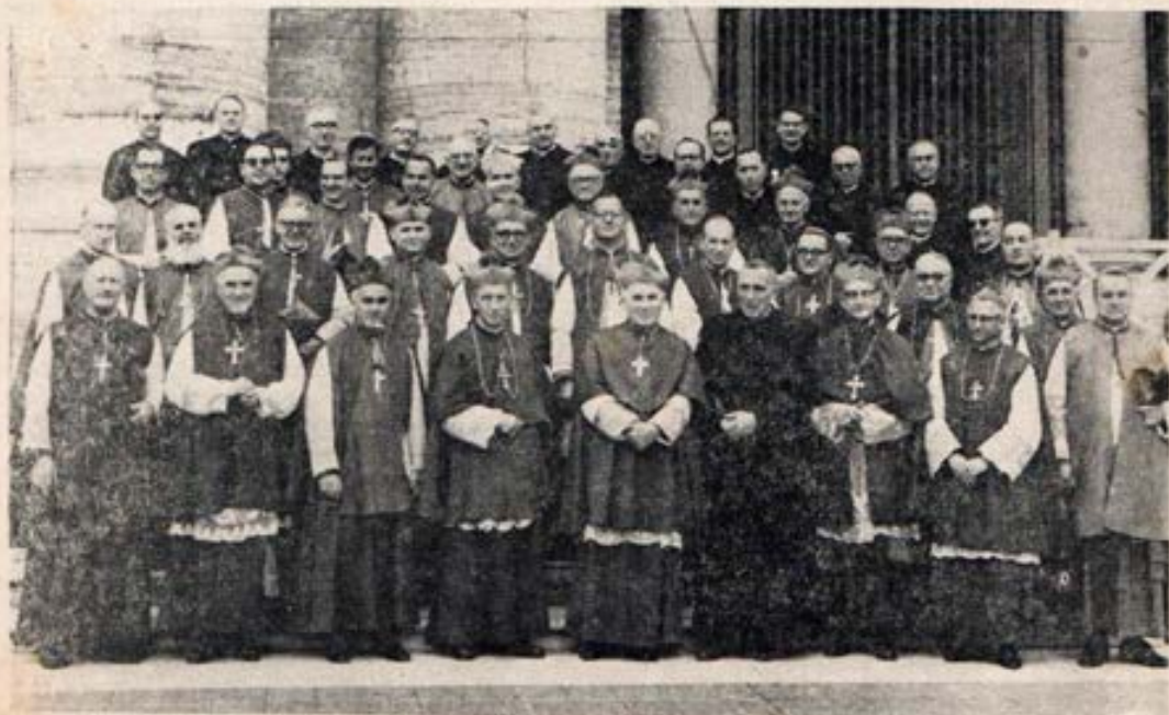
Obispos salesianos con el Rvmo. D. Renato Ziggiotti

Extraordinarias palabras de una madre: "Decir misa es padecer".