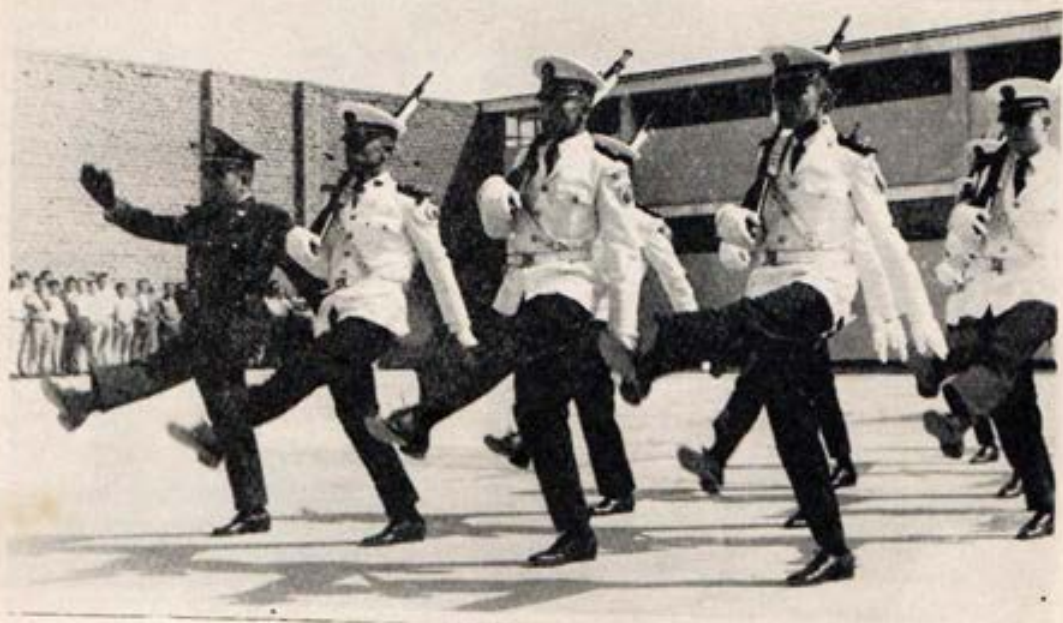
La Escolta del Colegio Militar Elias Aguirre encabeza el desfile después de la función religiosa en honor a María Auxiliadora.