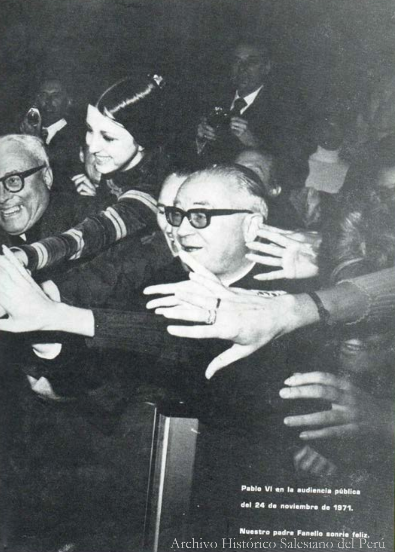
Pablo VI en la audiencia pública del 24 de noviembre de 1971.