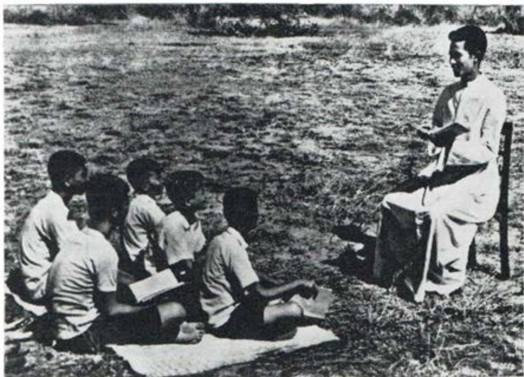
Thailandia: Un salesiano, estudiante de Teología, enseña catecismo a los pequeños.