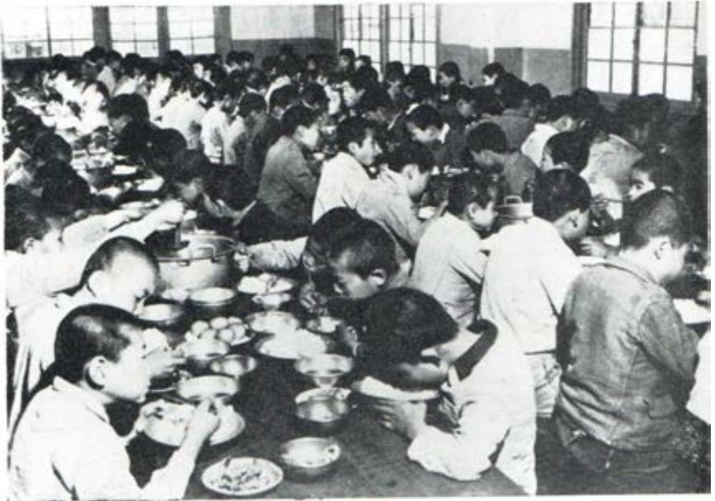
Tristes dividendos de una guerra: muchachos de un orfanato salesiano en Asia