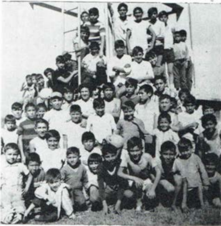
Un grupo de oratorianos atendidos por nuestros novicios de Cochabamba - Bolivia.

Creemos haber realizado con los escasos recursos de tiempo y medios económicos, un trabajo de promoción humana y cristiana que con el tiempo dará sus frutos.