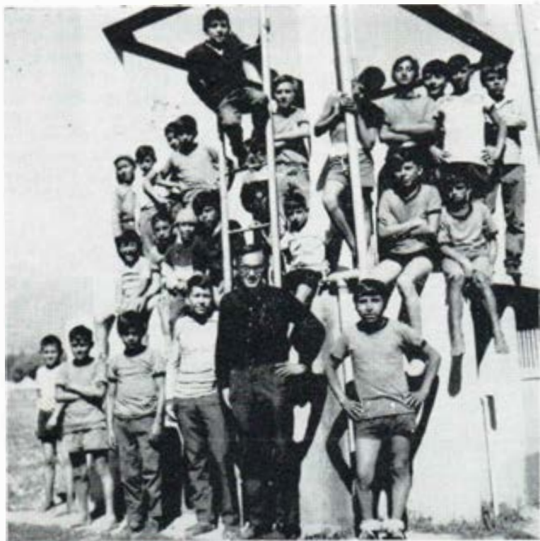
Oratorianos de Tiquipaya, Cochabamba.

En los principios de nuestra vida de Noviciado nos hemos propuesto algunos puntos concretos con respeto a los oratorios; como base tuvimos este principio: "Al no preocuparnos de salvar a los otros, no realizamos ni el acontecimiento de la Iglesia, ni nuestra formación".