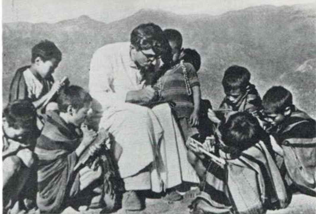
Un Padre salesiano en Hong-Kong enseñando a escribir a un grupo de niños chinos.