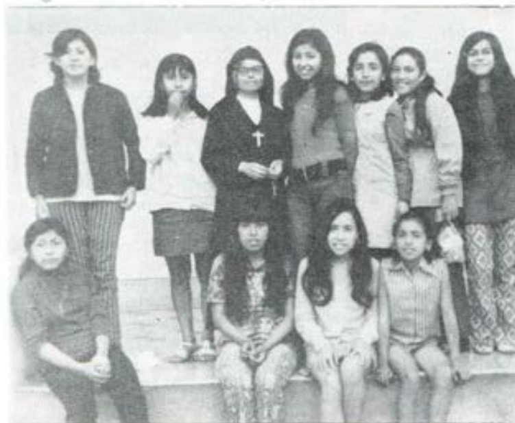
Un grupo de alegres jóvenes del Oratorio de las Hijas de María Auxiliadora, en Magdalena.

El año que acaba de fenecer se distinguió por la intercomunicación con los oratorios aledaños y con los centros juveniles que organizan las Hijas de María Auxiliadora. Y así menudearon los campeonatos con las oratorianas del