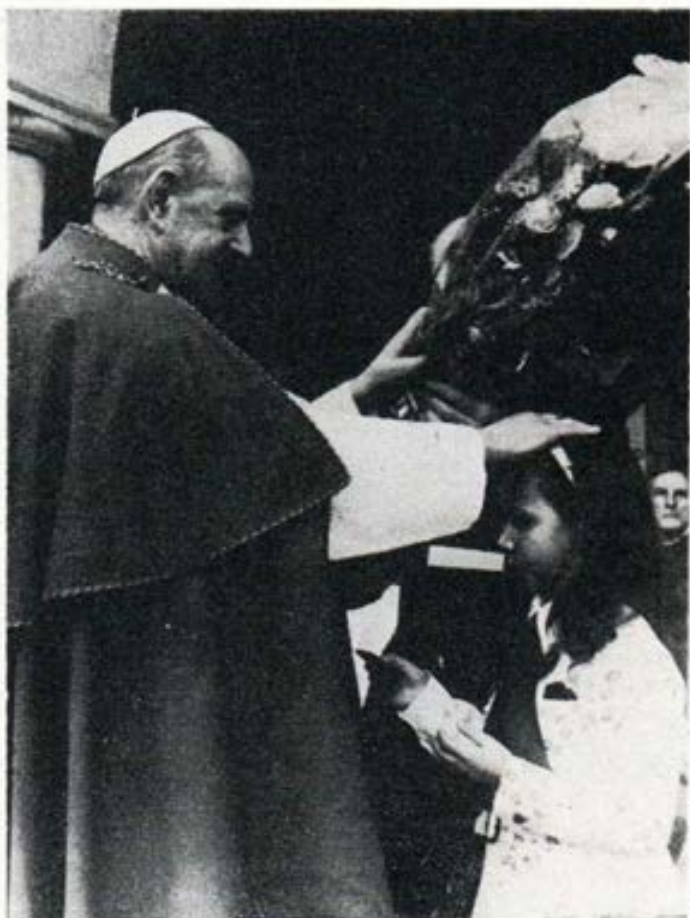
Paulo VI en una visita a la Parroquia Salesiana "María Auxiliadora" (Roma, Italia)

Con motivo de la Asamblea general extraordinaria de la Oficina Internacional de la Enseñanza Católica, habéis deseado vivamente hacernos una visita. Tened la evidencia que es inmensa nuestra alegría por recibirlos y por compartir vuestras preocupaciones y vuestras esperanzas. Al conocer el programa de vuestra reunión, nos hemos percatado hasta qué punto vuestra Oficina Internacional estaba deseosa de expresar de nuevo su identidad y su cometido al servicio de todos los organismos de la educación, y particularmente de la Enseñanza Católica, mantenida con su carácter propio. Os felicitamos por la labor realizada durante estas jornadas romanas que, indudablemente, producirán sus frutos.