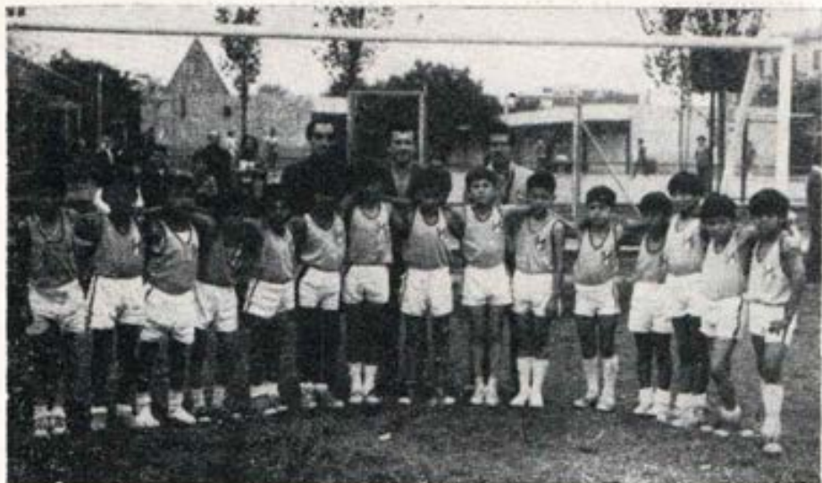
Equipo total del Colegio Salesiano