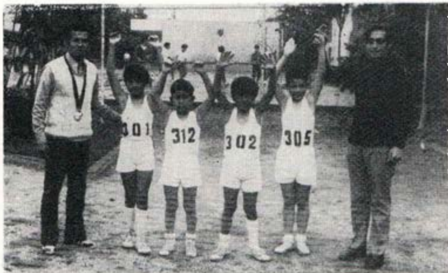
Posta del Colegio Salesiano (Serie eliminatoria)