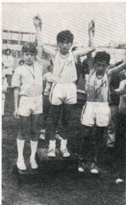
Los campeones de 300 metros planos.