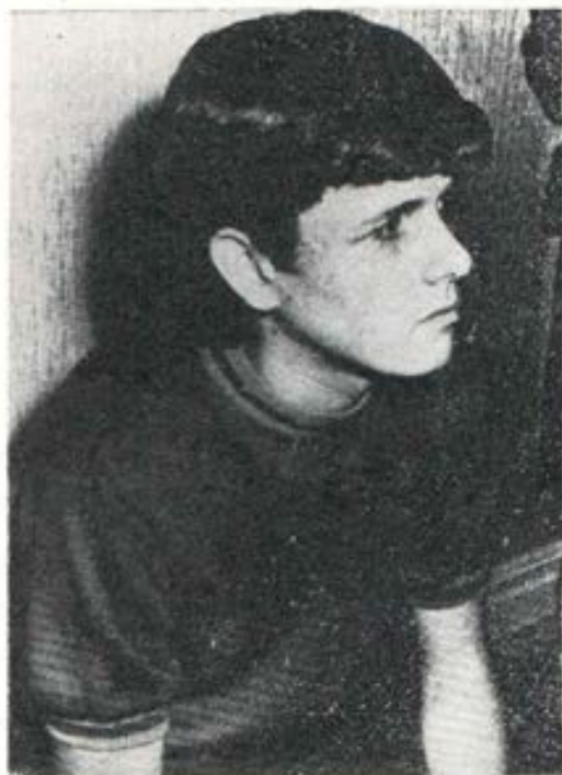
Cada muchacho, un misterio

¿Qué es el amor? Mejor que definirlo es contemplarlo. El ejemplo viviente de esposos que se aman, se respetan y trabajan unidos es la lección más vital. El que vive en una familia donde todo se hace por amor, desde la infancia hasta la madurez, formará luego un hogar semejante o será religioso o sacerdote entregado al amor del prójimo. El hogar donde reina el amor sincero es la mejor escuela de la vida. Nadie ni nada la puede suplir o suplantar. Enseñar a amar es ir ha-