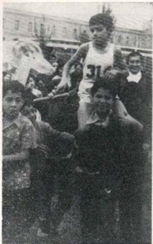
Campeón de serie en postas.