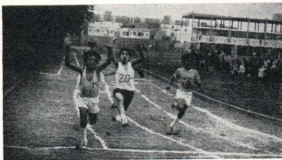
Llegada 50 metros planos