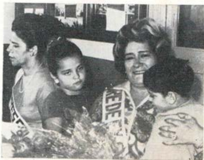
Las dos madres que recibieron los presentes de la Unión de Exalumnos Salesianos, con motivo del Día de la Madre.

hijo, las horas de sueño que necesita, los momentos de intimidad en el hogar, el trabajo escolar, las diversiones, los compañeros, los amigos, etc. Todo debe ser tenido en cuenta por los educadores. Y además es importante saber que cada niño o joven es diferente. Se pueden trazar líneas generales pero no podemos aplicar un método a todos ni usar las mismas normas para todas las edades.