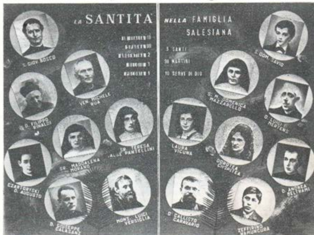
Algunos de los miembros de la familia salesiana canonizados y en proceso de canonización.