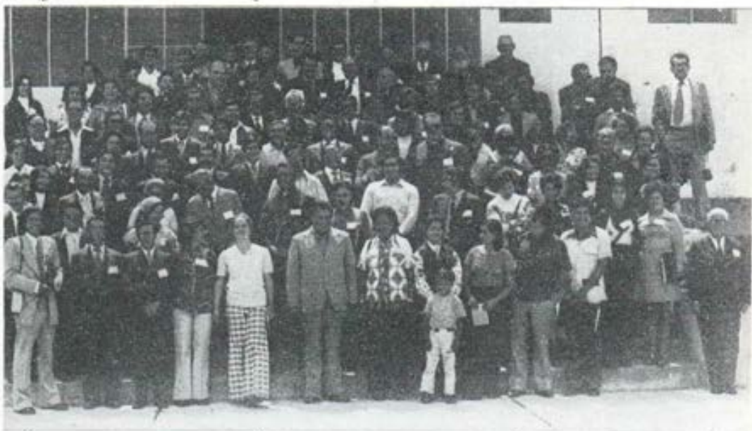
Participantes en el 3er. Congreso Grancolombiano de Exalumnos Salesianos, celebrado en Quito-Ecuador en Setiembre de 1974.