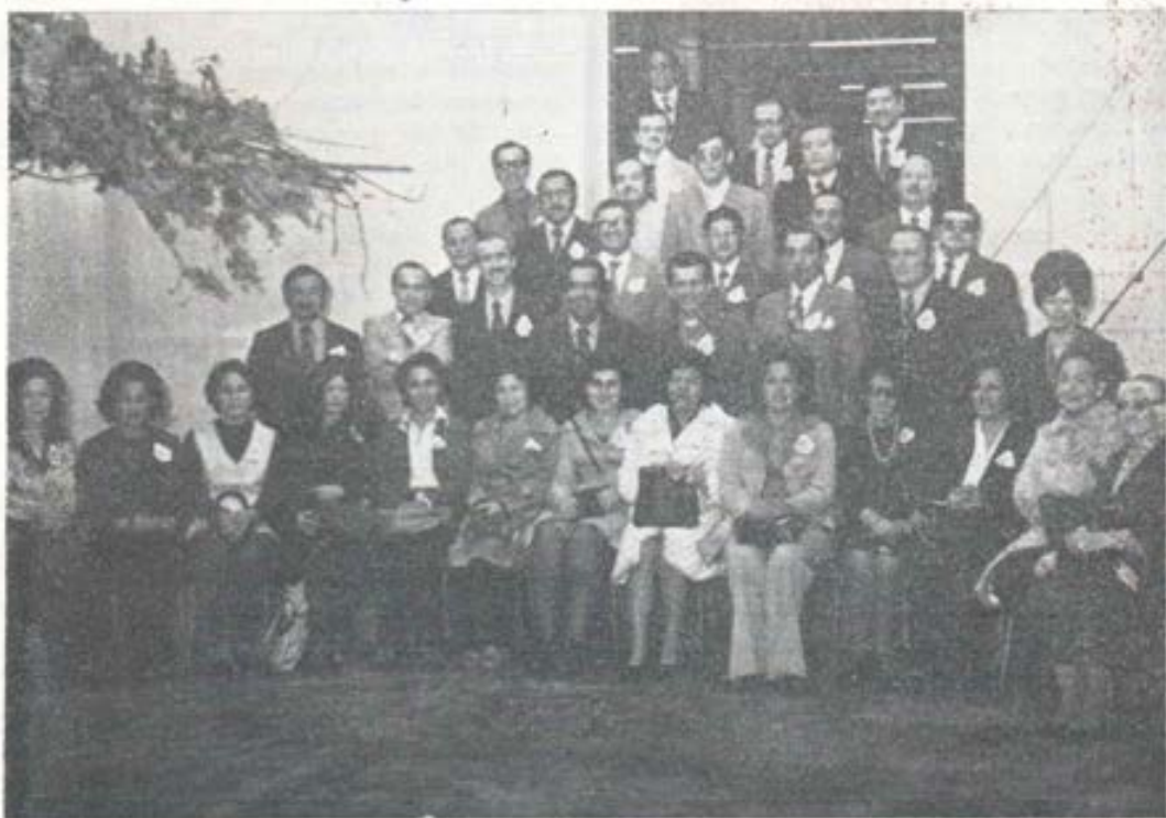
Padrinos de la ceremonia de Bendición e Inauguración de las obras de refacción del Salón de Actuaciones de la Unión de Exalumnos Salesianos.