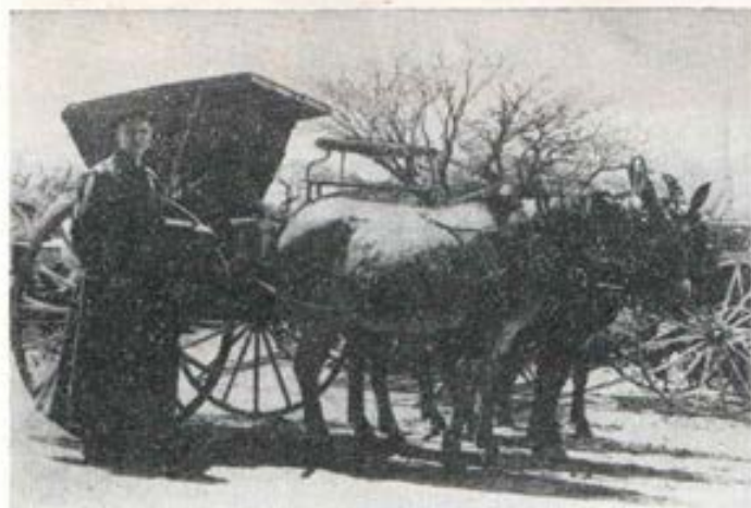
Un misionero enviado por Don Bosco, cumpliendo su labor apostólica en las pampas del sur argentino.

Terminado su mensaje se sienta, y se levanta Don Bosco. Agradece. Asegura al señor Cónsul que está de acuerdo y que cuando tenga el permiso del Papa procederá de inmediato a mandar misioneros a la República Argentina.