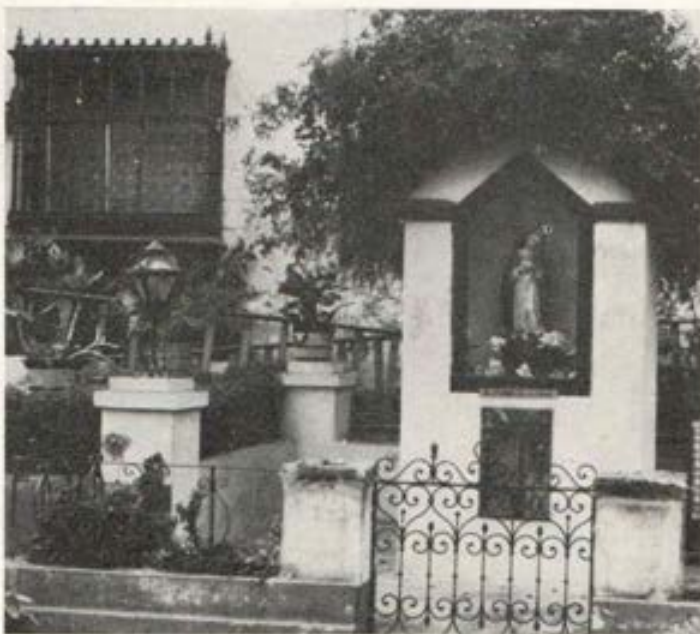
El lugar de la primera ermita en el jardín de Santa Rosa en la actual Avenida Tacna

La proclamación del Reino en el Magnificat de María es el grito de esperanza para los pobres y para todos cuantos se empeñan en la implantación de la justicia por el Reino de los cielos.