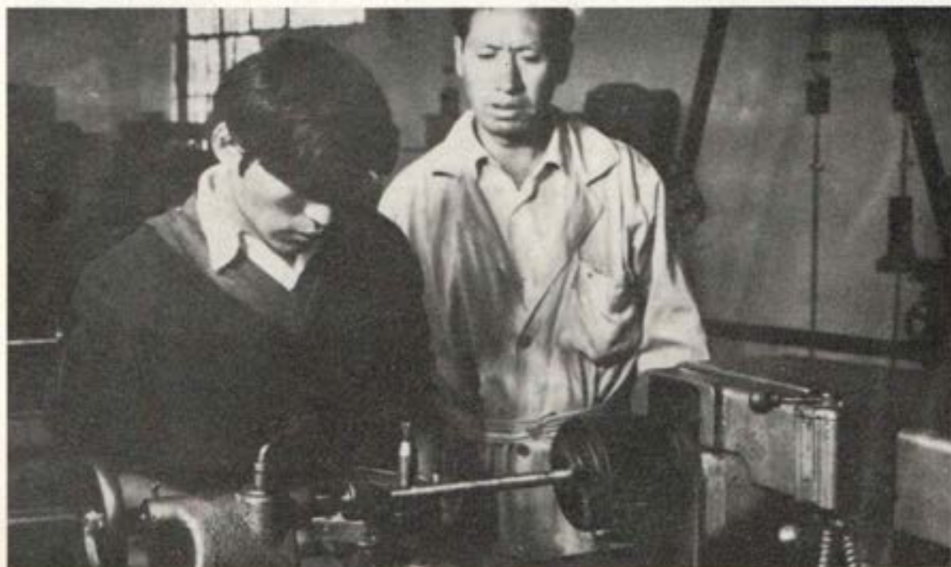
Alumno tornero en el Centro Juvenil de Huancayo

Los días 26, 27 y 28 de marzo se tuvo en Umuto (casa de retiro del Arzobispado de Huancayo) la concentración de 48 profesores de las secciones Primaria y Secundaria del Colegio, y del Centro Juvenil. Cinco Salesianos los acompañaban. Todos estuvieron internos. La finalidad era reflexionar juntos sobre la importancia de nuestra labor.