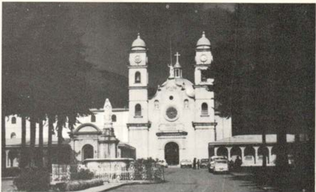
Primer Seminario Misionero de América. Cumple 250 años.