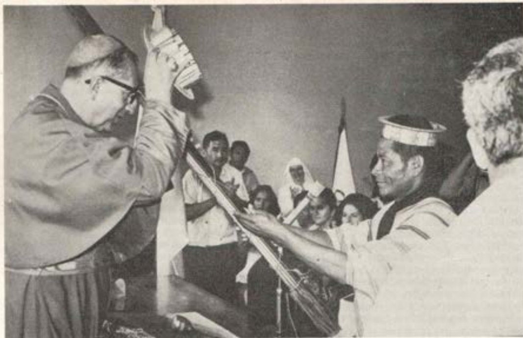
El jefe de la comunidad indígena "Campa" de Pampa Michi (San Ramón) entregando las flechas y el característico sombrerito de los campas al Cardenal Juan Landázuri, quien cumple 20 años como Arzobispo de Lima.