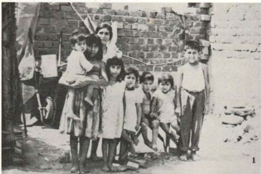
Cuadros así ¿no nos mueven a ser protagonistas en la construcción de una sociedad nueva?