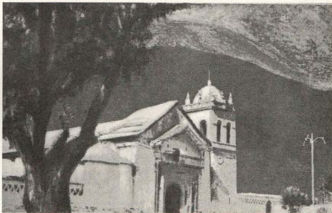
Templo de Calca (Cuzco), una verdadera joya de las más antiguas en toda la región del sur del Perú

En la Asamblea Presbiterial mensual del Arzobispado del Cuzco, del 21 de mayo último, quedó distribuida esta circunscripción eclesiástica en siete Vicarías Pastorales. Una de ellas es la VICARIA PASTORAL DEL VALLE SAGRADO.