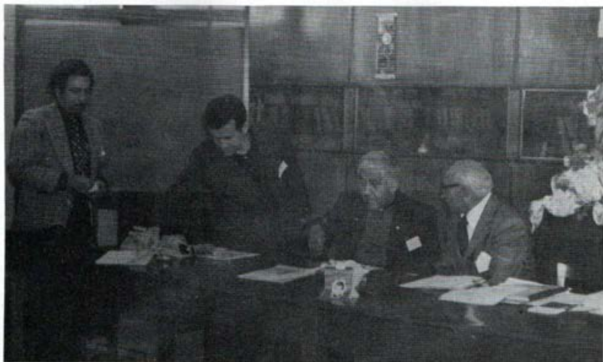
Mesa Directiva en un cambio de opiniones. II Asamblea Nacional 1975.

res cooperadores o apóstoles laicos como miembros vivos de la Iglesia en el mundo.