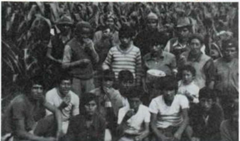
Compartiendo con ellos trabajo y pan.... en Calca.