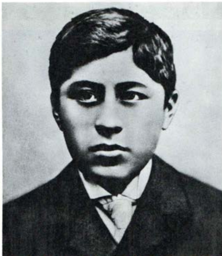
Servo de Dios Ceferino Namuncurá, hijo de las Pampas Patagónicas y fruto de la labor de los Misioneros Salesianos.