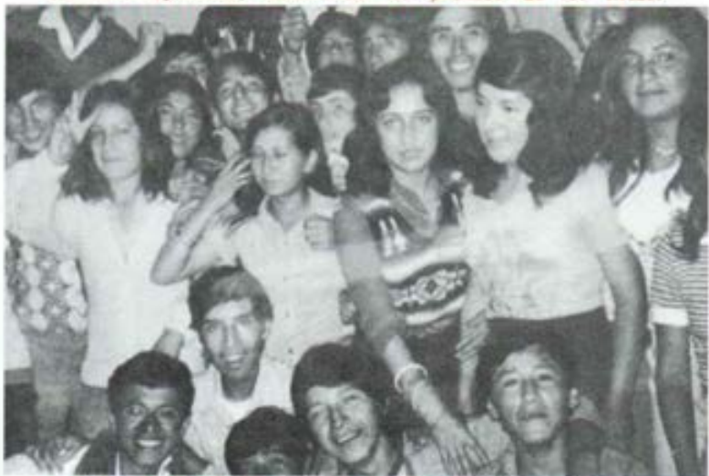
Fiesta juvenil en honor de San Juan Bosco. Calca.