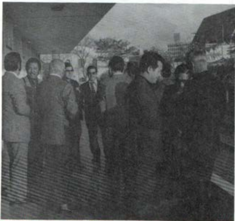
Comentario previo a las Conclusiones, II Asamblea Nacional 1976.

Este llamado los invita a dar testimonio de Cristo y de su Evangelio a través de su presencia eficaz en las estructuras sociales en que se desempeñan como trabajadores y como padres de familia.