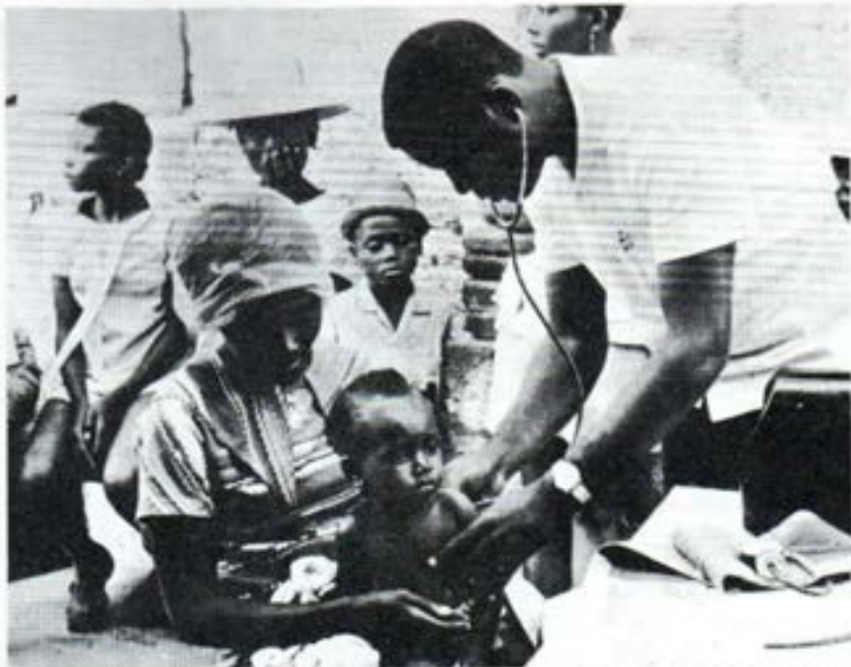
Thorland, suburbio de Puerto Príncipe (Haití). "Centro Social María Auxiliadora". Allí trabajan desde 1970 cinco Hijas de María Auxiliadora. Es Escuela Elemental y Profesional, Escuela de catequistas, Obra Social; Dispensario. En la foto: Curando los cuerpos en el Dispensario.

Todas nuestras parroquias, menos la de Rosario, comprenden zonas bastante céntricas, pero con muchos barrios de periferia; y el personal salesiano está muy preocupado por atender preferentemente a estas zonas más pobres. Los que trabajan en estos barrios fomentan una acción pastoral de promoción, mancomunada