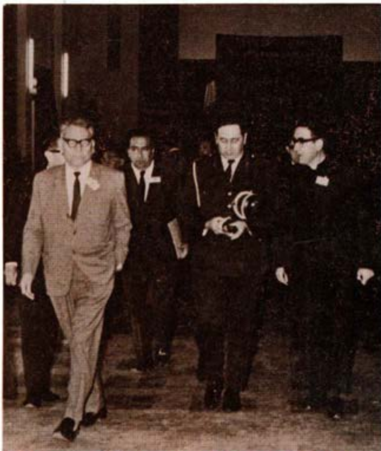
El Representante del Gobierno, con el P. Inspector y los Presidentes de la Federación y de las Uniones. Primer Congreso Peruano 6-9-70.

En este sentido los exhortamos a que dentro del movimiento de exalumnos, los que tengan cualidades y voluntad y sientan su vocación salesiana, se organicen o como cooperadores o en grupos apostólicamente comprometidos, para una más íntima participa-