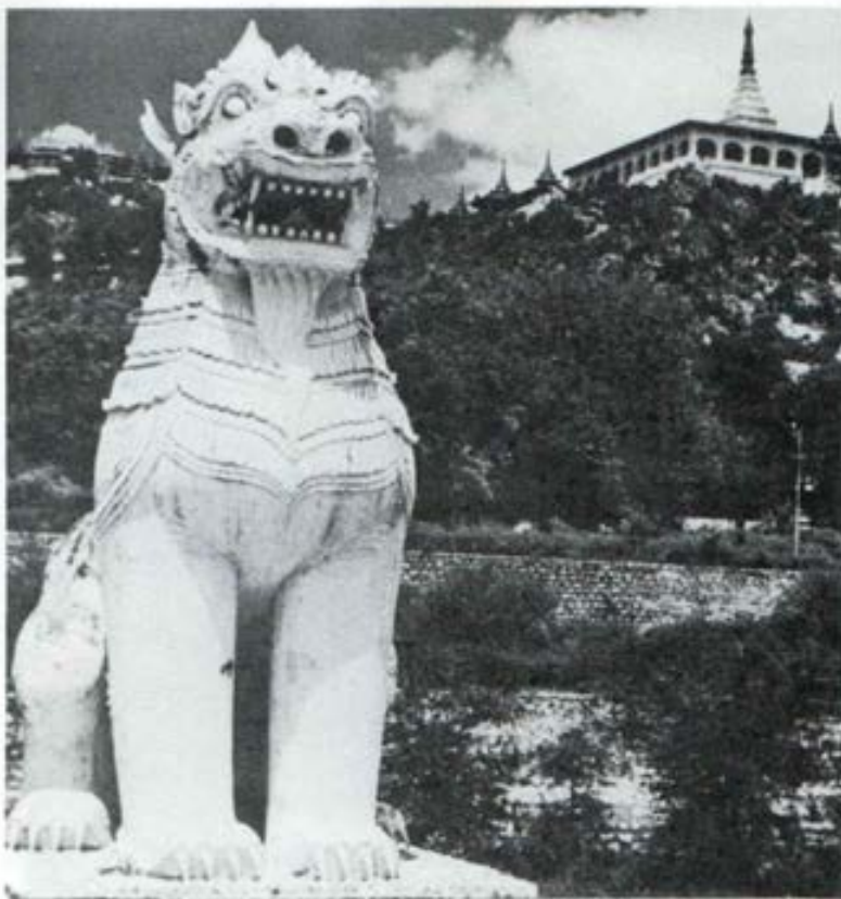
Panorama birmano, con los monumentos de la religión budista. Los Salesianos trabajan en Birmania desde la postguerra. Recientemente ha nacido la Prefectura Apostólica de Lashio, en que se desarrolla la obra de Don Bosco.