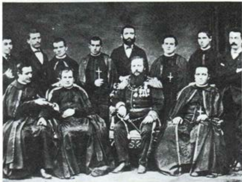
El primer grupo de Misioneros Salesianos que partió para la Argentina, Turín 1875.