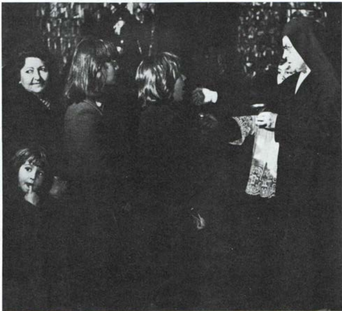
Una de las dieciocho Hermanas Salesianas que administran la Sagrada Eucaristía.

18 HIJAS DE MARIA AUXILIADORA LLEVARAN LA COMUNION A LOS ENFERMOS EN ROMA.