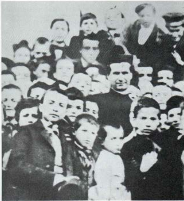
Auténtica fotografía de San Juan Bosco entre los muchachos del Oratorio de Turín, tomada en 1860.

presiones del Colegio que, a veces son muy dolorosas. En el primer examen semestral