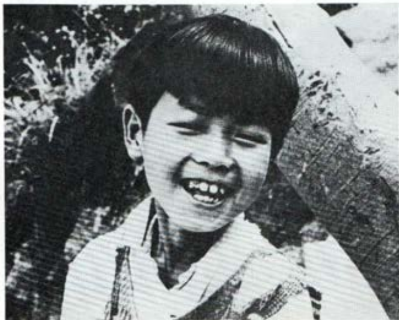
Sonriente alumna de las Escuela Salesiana de Hong Kong.