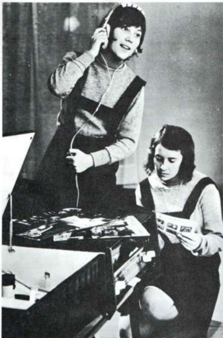
Dos alumnas del Colegio de Huérfanas de las Hijas de María Auxiliadora en Palencia, España. La música es parte esencial en el programa educativo salesiano: hoy se hace liturgia y mañana festival, siempre expresión de una sensibilidad que habrá que despertar y encauzar.

El pueblo, una ciudad de 150,000 habitantes, se llama San Pedro Tlaquepaque; propiamente hablan-