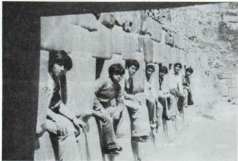
En Ollantaytambo, admirando las proezas de los Incas.