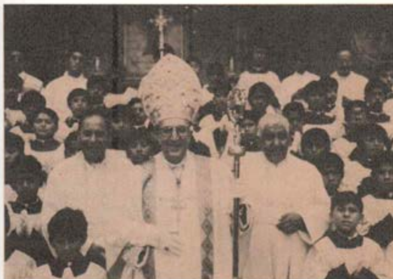
El pequeño Clero del Colegio Salesiano de Lima que tan destacadamente contribuye al esplendor de las funciones litúrgicas de la Basílica de María Auxiliadora. Aquí con el Cardenal Landázuri, en 1980.