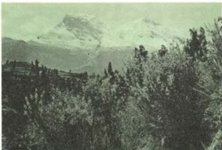
El Huascarán, nevado bicéfalo a 6,768 m.s.m. Ancash - Perú.