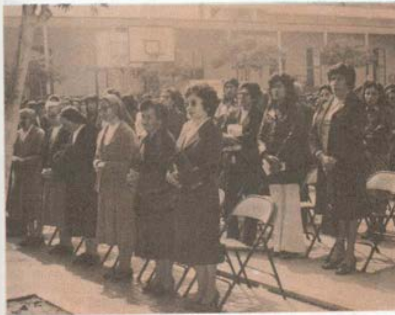
Algunas actividades de las Hijas de María Auxiliadora en su Colegio de Breña - Lima.

en las culturas del mundo, están acelerando su ritmo en estos meses. La humilde hija de Mornés se da a conocer y se hace acoger desde el video y desde la pantalla, da nombre a nuevas calles de ciudades y pueblos, es aplaudida en los estadios e invocada en imponentes y concurridas concelebraciones eucarísticas... Celebraciones que, muy gustosa, rehuiría la Santa con todas sus fuerzas pero que Don Bosco, opinó, promovería. Signos de valores que surgen de una original experiencia de Espíritu Santo vivida ayer, para descubrir hoy en el corazón de cada HMA y de todo el Instituto, la capacidad de acoger el mismo don y llevarlo al nuevo milenio que ya llama a la puerta.