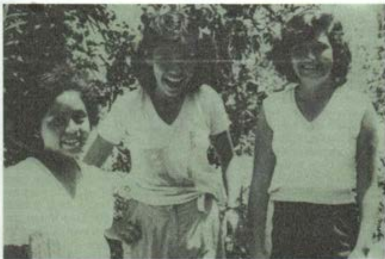
Rostros alegres en la juventud de nuestra Parroquia de María Auxiliadora de Breña - Lima.