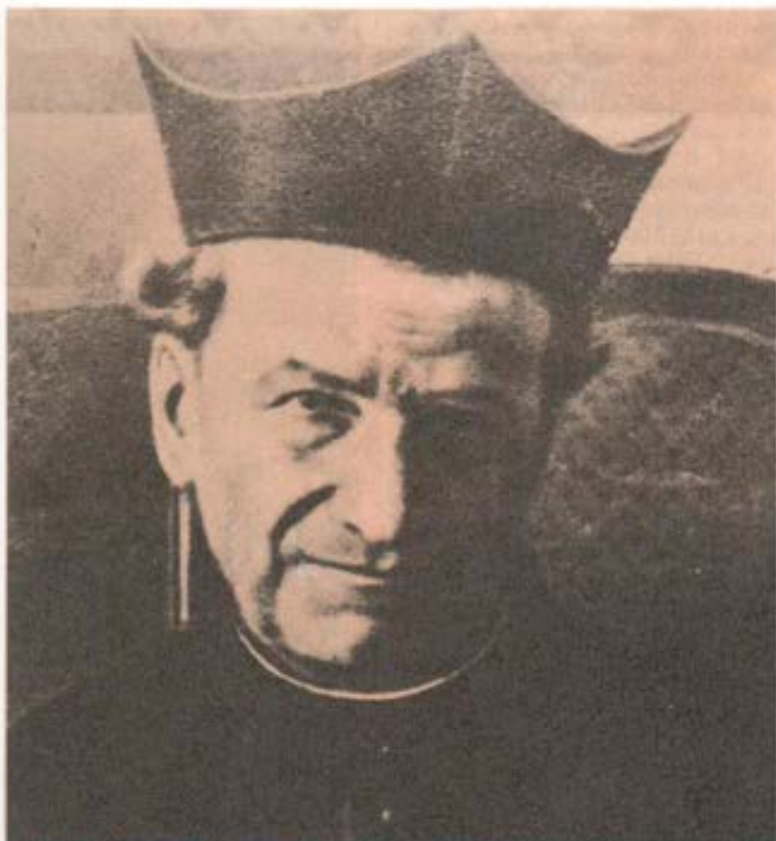
Don Bosco (1815 - 1888).

— Déjenme un momento solo. Todos se retiran, menos la madre y la tía del extinto. Se cierra la puerta y Don Bosco eleva una ferviente oración a Dios. En seguida, da una bendición al cadáver y con un tono imperativo lo llama: