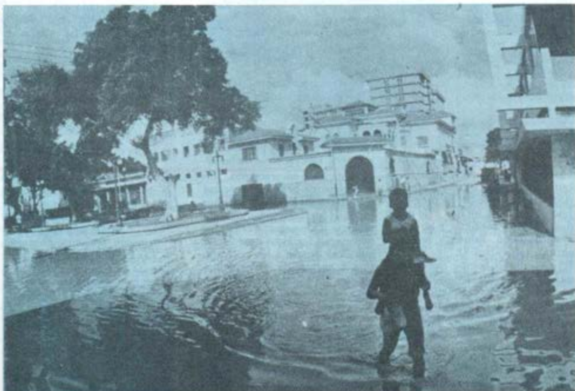
Calles Apurímac y Lima, en el centro de Piura, anegadas por las aguas del río Piura.

cordia de Dios que así mueve a la conversión: "Cuando empiece a suceder esto, pónganse de pie y alcen la cabeza que se acerca la liberación". (Lc. XXI, 28). Es la pedagogía de Dios que nos invita a conservar siempre "abiertos los ojos de la fe" para descubrir en nuestros hermanos pobres o dolientes el rostro de Cristo, que con frecuencia desconocemos en la vida ordinaria. No cabe duda que nuestra sociedad peruana está necesitando una profunda conversión que la purifique de muchos pecados que la alejan de Dios y destruyen la familia humana: inconsciencia de los que buscan enriquecerse materialmente aun a costa de la ruina moral de otros, como el caso de los narcotraficantes y los que comercian con la pornografía y el desenfreno de las bajas pasiones; deshonestidad frecuente en los que teniendo la responsabilidad de servicios públicos