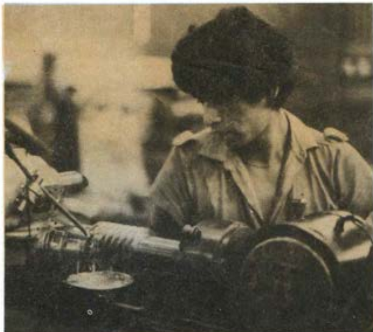
Alumno de mecánica en nuestro Politécnico Salesiano de Breña.