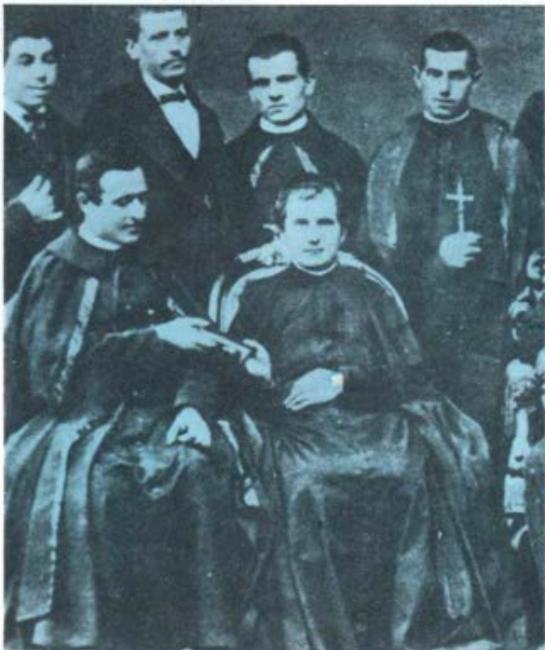
Don Bosco y Don Cagliero. (11 de Noviembre de 1875).

que el veredicto sea ratificado por Dios mismo.