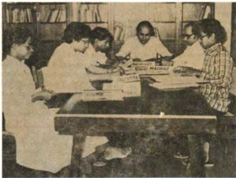
Comisión Salesiana de la India, para la Pastoral Juvenil. Bangalur. En la sede provincial de los Salesianos, se ha reunido la Comisión Nacional para el apostolado entre los jóvenes. Se analizaron las conclusiones del seminario continental que había tratado el tema del Sistema Educativo de Don Bosco en el contexto asiático.

Después de indicar lo que se ha podido hacer para intervenir inmediatamente, el Arzobispo si-