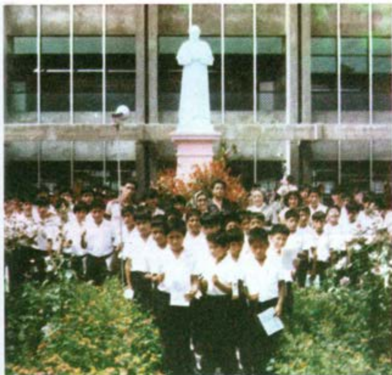
En el Cenecape María A. Cruzadora de la Av. Brasil el día de la Primera Comunión.