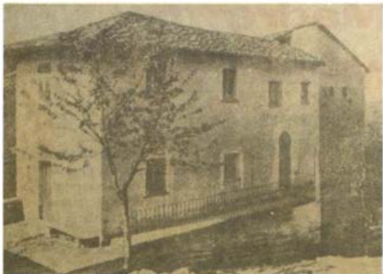
Casa nativa de la Madre María Mazzarello.

Dios instituyendo su fiesta anual el 24 de mayo de 1815, una vez calmado el ciclón de las guerras napoleónicas y terminado su doloroso cautiverio.