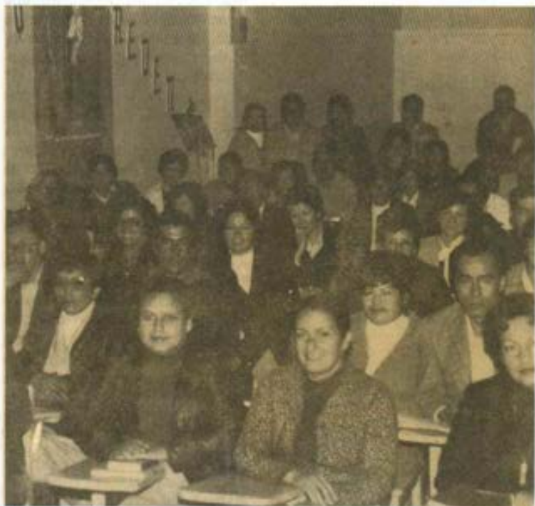
Jornada de Padres de Familia que se preparan para ser animadores de la Catequesis Familiar en cada uno de sus hogares.