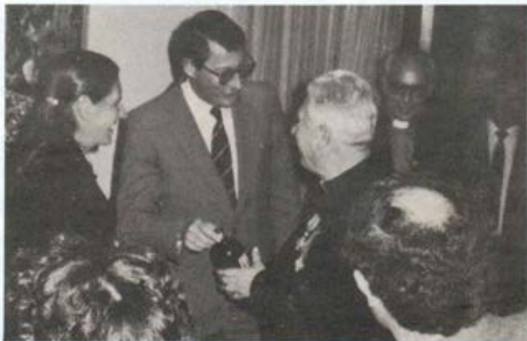
El Padre Schoutens con el representante del Embajador de Holanda.