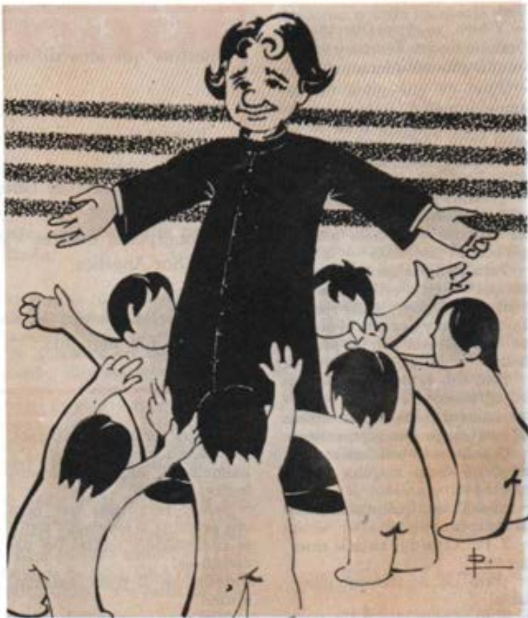
Don Bosco amigo de los niños, caricaturizado en este dibujo. Aparece como un "Padre".

— Ah, sí sí, conozco muy bien al antiguo amigo de mi alma, al que ha dado tantos consejos y