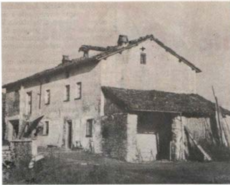
La Valponasca con las modificaciones sucesivas.

gárnosla, la adoptaremos como hija. Así se remediará nuestra soledad.