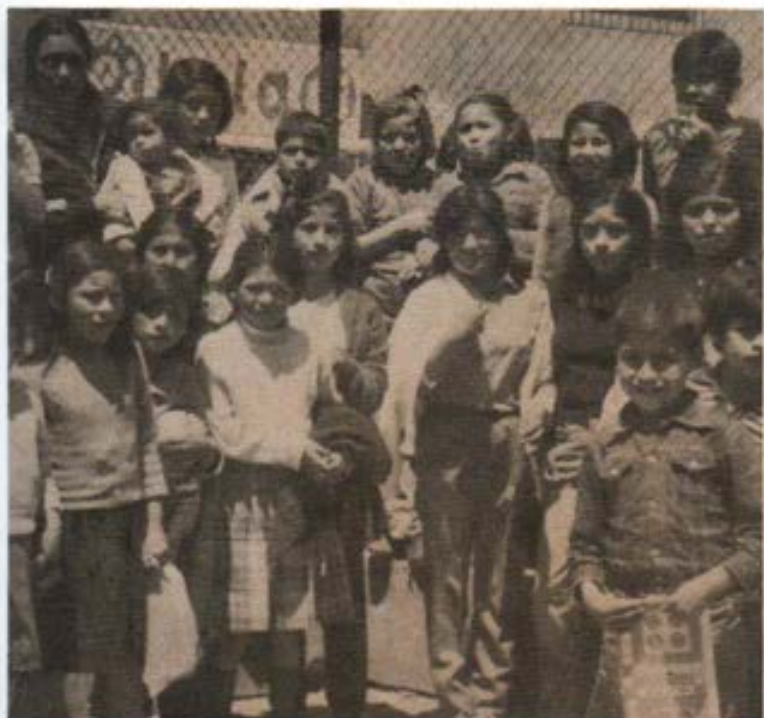
Oratorio Salesiano Cusco 1983.

cerlas siempre más capaz de responder a los reclamos de las personas, de los tiempos, de los lugares y de las culturas.