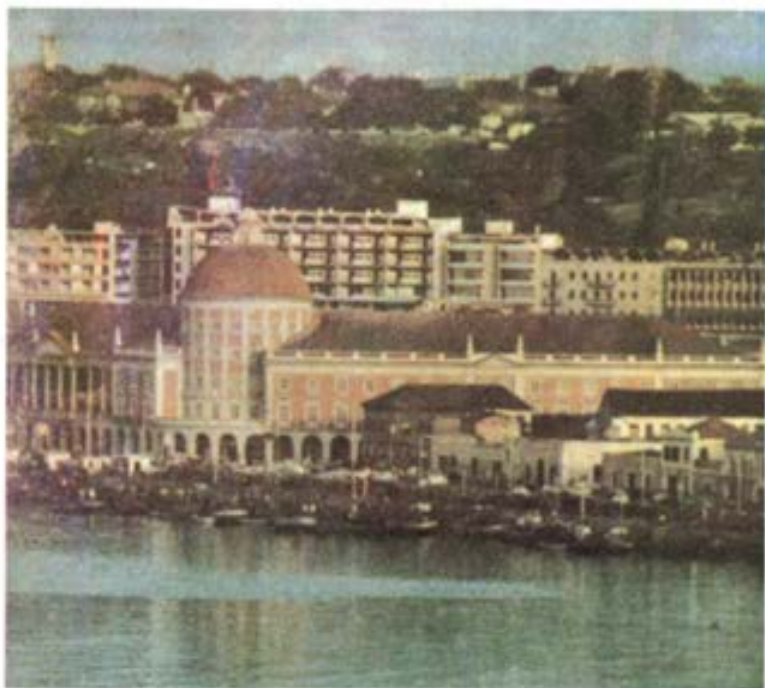
Una vista de Luanda, la capital de Angola.