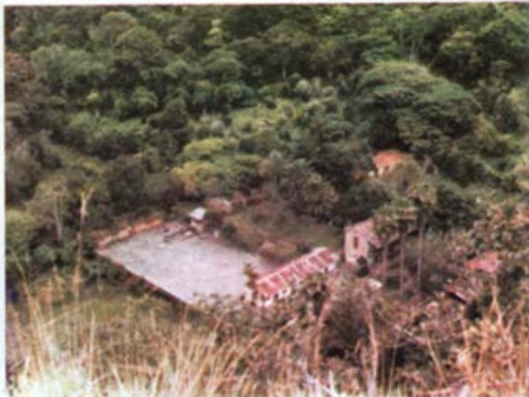
Detalle panorámico de Monte Salvado.

Los técnicos concluyen este importante trabajo demostrando su viabilidad. Ven en la parte agrícola la fuente de mayores recursos, principalmente en los primeros años. Tiene en cuenta una