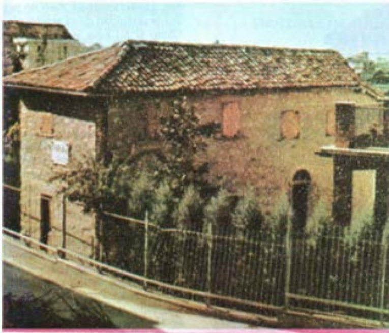
Casa donde nacio Maria Mazzarello.

podía colmar aquel gran corazón sediento y vehemente que le ardía en el pecho.