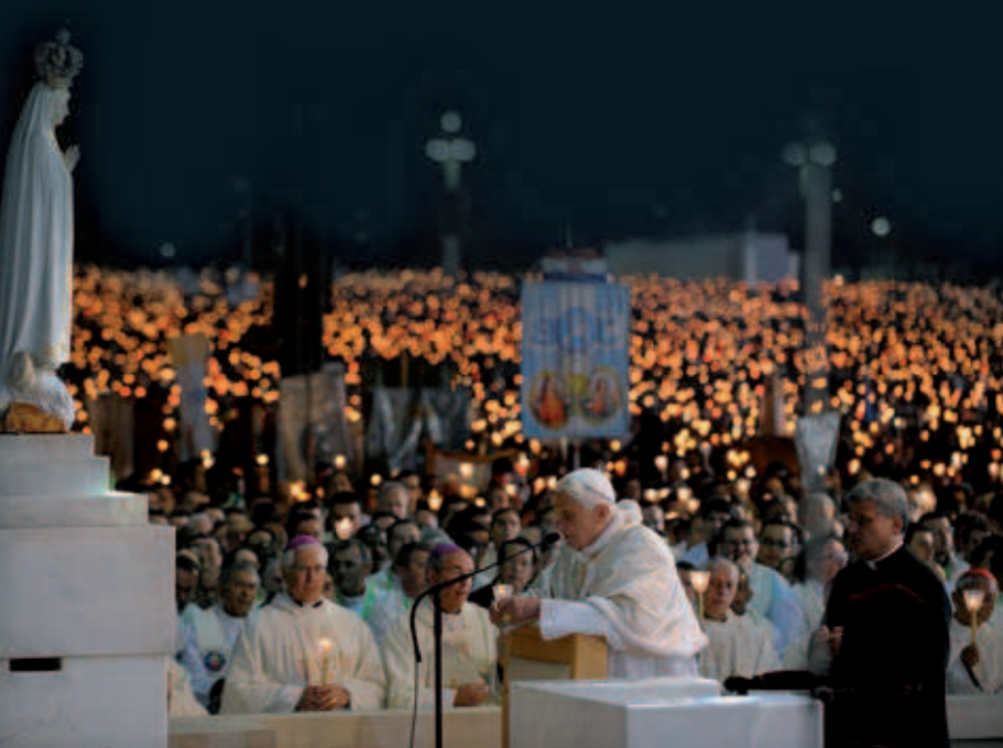
Medio millón de fieles acompañan al Papa Benedicto XVI en el homenaje a la Virgen de Fátima (Portuga)

tra las que el espíritu inteligente y creyente debe luchar y ser tenaz.