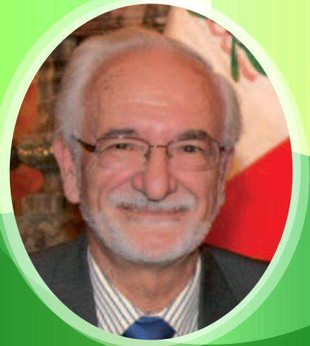
Dr. Antonio Brack Egg Ilustre Ex-alumno Salesiano

La redacción final del Documento del Capítulo Inspectorial quedó en manos de la Comisión respectiva y espera la aprobación del Rector Mayor ☺