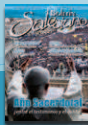
Foto: Benedicto XVI en la Plaza de San Pedro El Vaticano

Dirección, redacción y administración: Av. Brasil 218 Breña (Lima-Perú) Teléfonos: (+511) 425-0880 332-8226 / Fax: (+511) 332-1725 Depósito legal: 2001-0722 E-mail: boletin@salesianos.pe / Página web: www.salesianos.pe/boletin Impresión: WORLD COLOR PERÚ S.A.