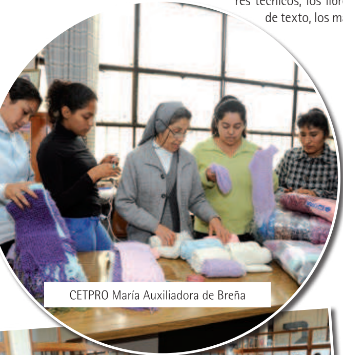
CETPRO María Auxiliadora de Breña

La reforma educativa de 1902 implantó la enseñanza práctica de estudios comerciales e industriales, como una sección anexa a los colegios regulares. Estas escuelas también tuvieron diversos resultados; mientras que algunas trabajaron satisfactoriamente algunos años, varias de ellas tuvieron que cerrarse o nunca llegaron a abrirse. Para 1915, los colegios que sobrevivieron, recibieron la crítica que desde sus aulas salían muchos bodegueros o comerciantes que se quedaban en sus tiendas, pero que no sabían producir o trabajar en cosas mecánicas que era lo que más necesitaba el país.