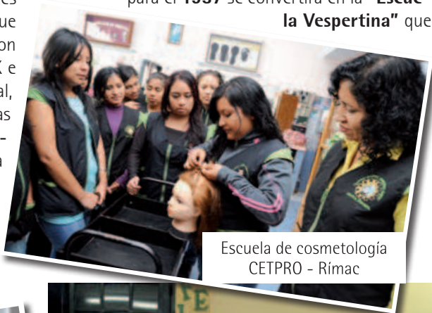
Escuela de cosmetología CETPRO - Rímac