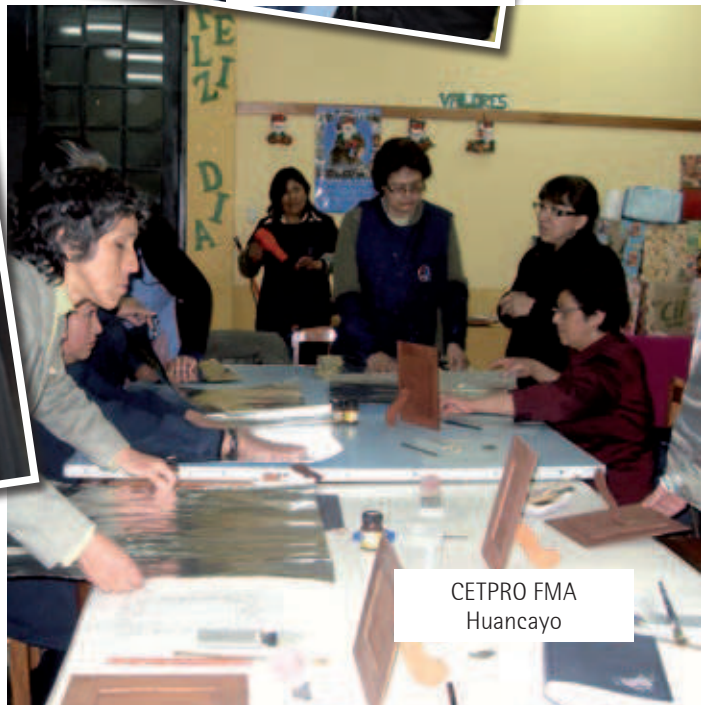
CETPRO FMA Huancayo