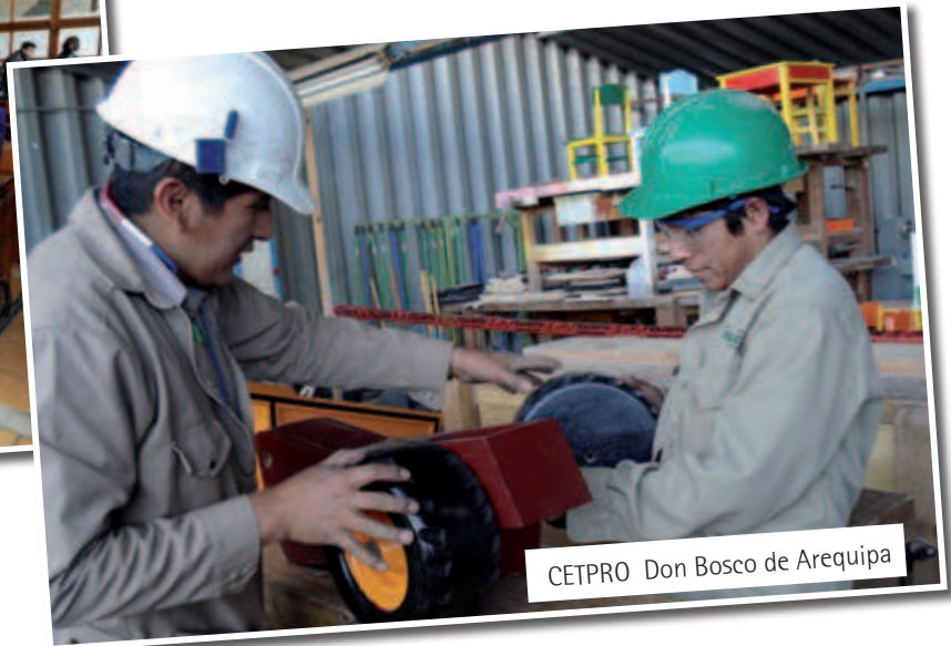
CETPRO Don Bosco de Arequipa