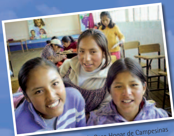
Cada niña es el alma de la Casa Hogar de Campesinas

Las Hijas de María Auxiliadora nacieron misioneras. Su presencia en el Perú así lo confirma cuando llegaron al Perú hace 120 años al instituto Sevilla, y desde sus inicios trabajaron por las jóvenes necesitadas en varias presencias del Perú. Actualmente destaca su servicio misionero en la zona altiplánica, donde se beneficia a chicas con el corazón salesiano y la alegría que la caracteriza a las FMA