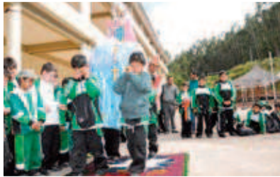
Alumnos y padres del Colegio Salesiano del Cusco vivieron con mucha devoción la fiesta de María