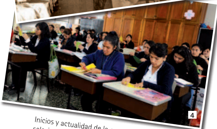
Inicios y actualidad de la enseñanza técnica salesiana. (1 y 2) Salesianos, (3 y 4) Hijas de María Auxiliadora.