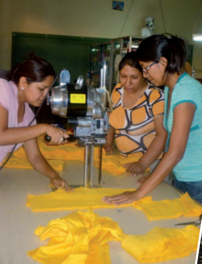
Producción Textil en CETPRO FMA de Piura

A partir del año 1978 se adquiere el nivel de CEO (Centro de Educación Ocupacional) que en la actualidad se han convertido en los CETPRO desde el 2004.