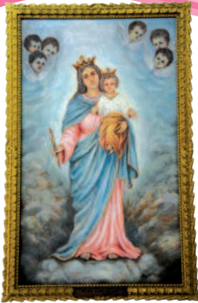
Cuadro de enviado por Don Rua con los primeros salesianos y salesianas