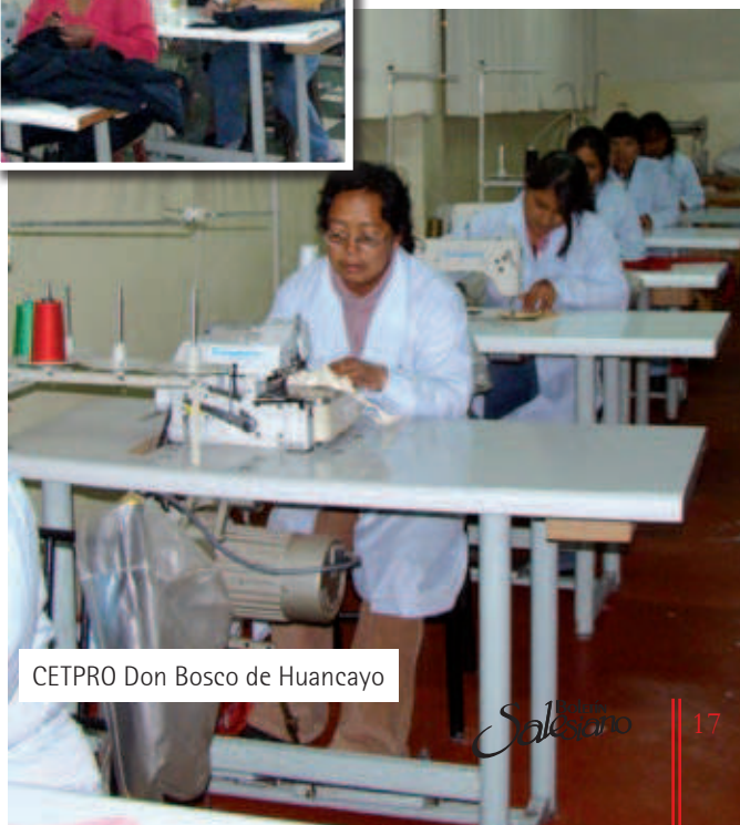
CETPRO Don Bosco de Huancayo