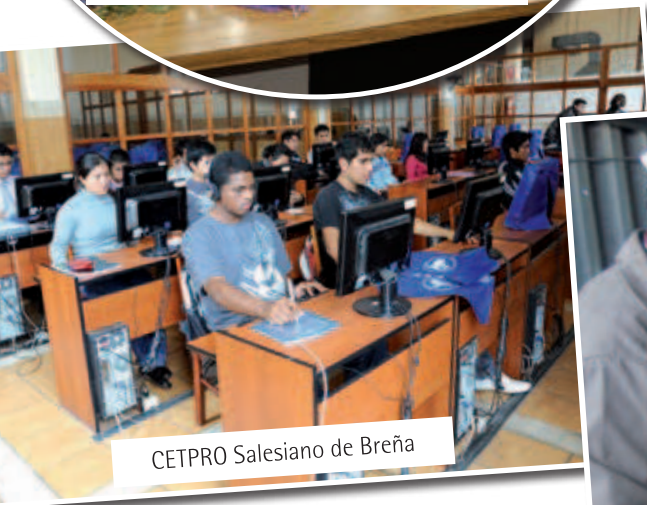
CETPRO Salesiano de Breña