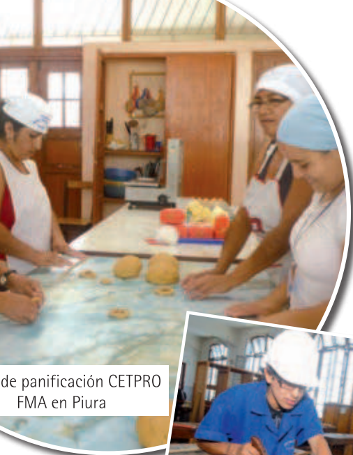
de panificación CETPRO FMA en Piura