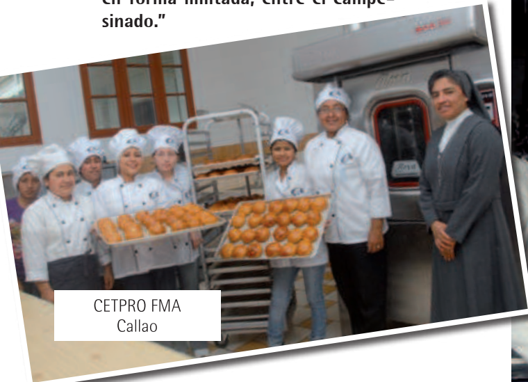
CETPRO FMA Callao