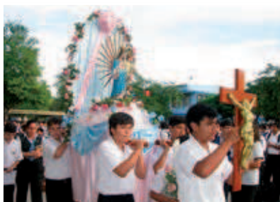
Estudiantes del Colegio Don Bosco de Piura devotos de María