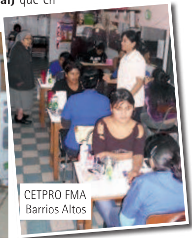
CETPRO FMA Barrios Altos