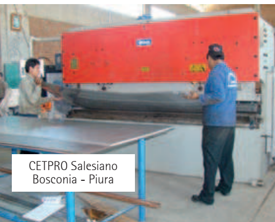
CETPRO Salesiano Bosconia - Piura

Queda pendiente la revitalización de estos servicios educativos y pastorales que favorecen a los jóvenes urgidos de una inserción profesional y laboral confiable y pertinente ☺